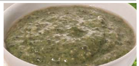
73135 GRÜNES PESTO KRÄUTERSAUCE PELLETS mit Pecorino, Knob. +Olivenöl, TK, 6 x 1 kg/Karton