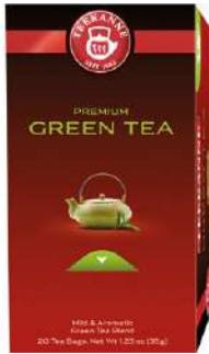
54531 PREMIUM GREEN TEA SELECTION 10 x 20 Stück/Karton