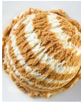
72414 CAPPUCCINO EIS TK, 5 Liter/Wanne