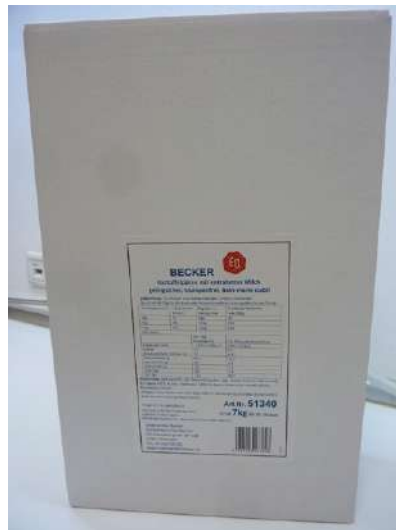
51340 PÜREE MIT MILCH heißquellend, 7 kg/Karton