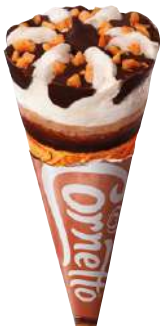
72403 CORNETTO HASELNUSS TK, 24 x 120 ml/Karton