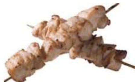
71211 HÄHNCHENFILETSPIESS gegart u. gebräunt, TK, 30 x ca. 125 g/Karton