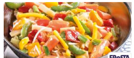
73113 ASIATISCHES WOK PFANNENGEMÜSE TK, 6 x 1,5 kg/Karton