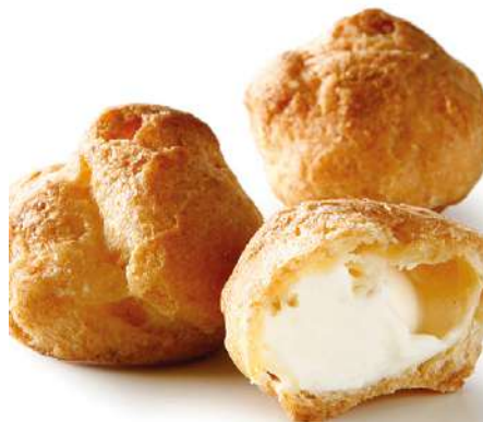
71848 MINI-WINDBEUTEL TK, fertig gebacken, Brandmasse gefüllt mit Sahne, 160 x ca. 12,5 g/Karton