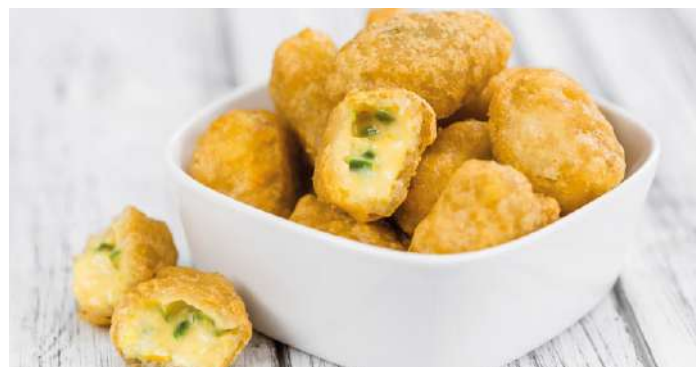
76433 CHILLI CHEESE NUGGETS TK, 6 x 1 kg á ca. 48 - 53 Stk./Beutel