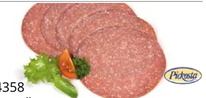
34358 GEFLÜGEL SALAMI geschnitten, Atmos, 500 g/Packung