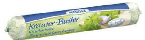
28763 KRÄUTERBUTTER ROLLE 4 Rollen à 250 g/Karton