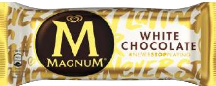
72400 MAGNUM WEISS TK, 20 x 120 ml/Karton