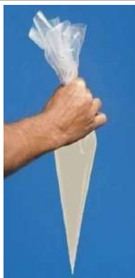
63736 SPRITZBEUTEL 55 cm lang, Einweg, 100 Stück/Paket