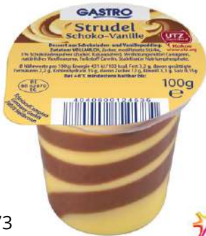
28373 GASTRO DUO-SWIRL STRUDEL SCHOKO/VANILLE 24 Becher à 100 g/Karton