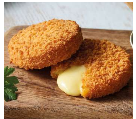
70271 BACK-CAMEMBERT 45% paniert, vorgebacken, TK, 24 x ca. 75 g/Karton