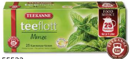
55532 TEEFLOTT PFEFFERMINZ 25 x 1Ltr. Kanne, 16 Stück/Karton