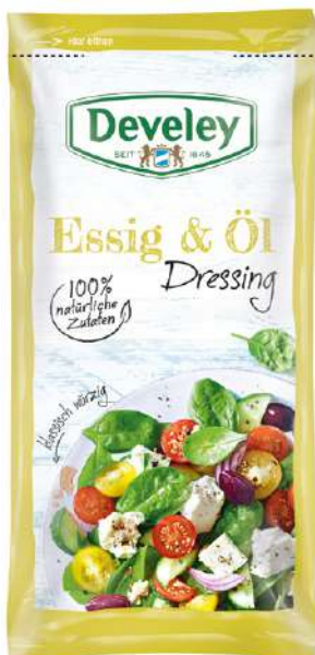
35394 ESSIG ÖL DRESSING 14 Beutel à 75 ml./Karton