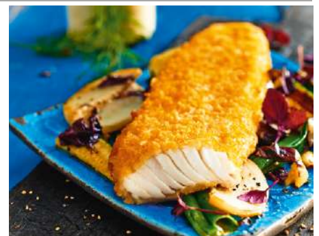
72230 ALASKA SEELACHSFILET Kartoffelpanade, Portionsfilet, TK, vorgebraten, 40 x 150 g/Karton