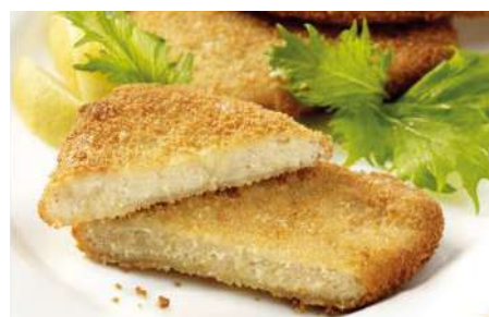
79517 VEG. WIENER SCHNITZEL TK, paniert, vorfrittiert, 40 x 80 g/Karton