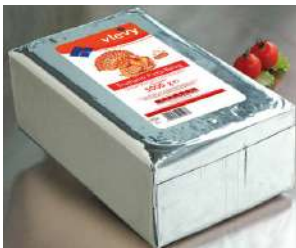
34611 TRUTHAHN PIZZA-BELAG 57 %, 4 x 5 kg Block/Karton