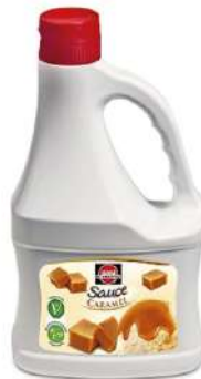
59377 CARAMELSAUCE o.d.Z. 2 kg/Flasche