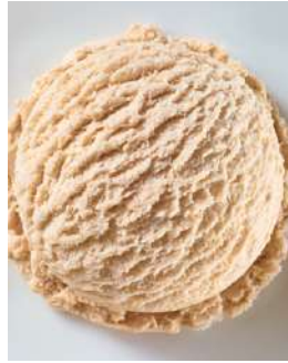
72413 HASELNUSS EIS TK, 5 Liter/Wanne