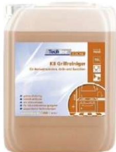
24388 GRILLREINIGER TECHLINE K8 10 Liter/Kanister