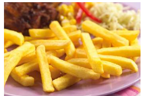
75156 TURBO PLUS POMMES TK, 10 mm, 5 x 2,5 kg/Karton