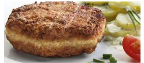
70609 BELFROST GEFLÜGELFRIKADELLE TK, 125 g, vorgebraten, 30 Stk./Karton