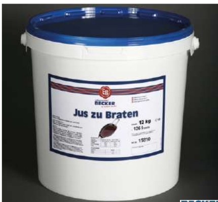
15810 JUS ZU BRATEN 12 kg ODPZ -A/Eimer