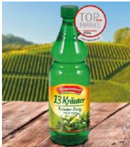
36526 13 KRÄUTER ESSIG 12 Flaschen á 0,75 Liter/Karton