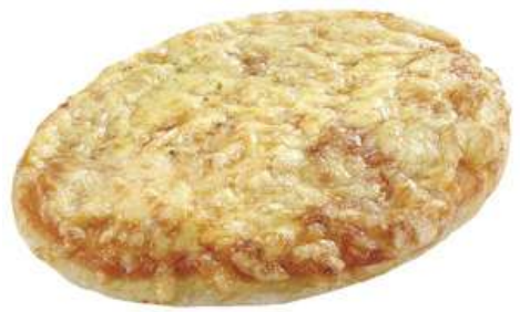
76045 PIZZA MARGHERITA Teigling, vorgegärt, TK, 36 x 132 g/Karton