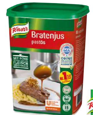
13495 BRATEN- JUS pastös, Gourmet, o.d.Z., 1,4 kg/Dose