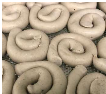
72169 GEFLÜGELBRATWURST- SCHNECKEN TK, gegart, 67 x ca. 75 g/Karton