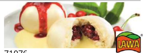
71076 BELFROST GERMKNÖDEL TK, Sauerkirsch, 30 x 170 g/Karton