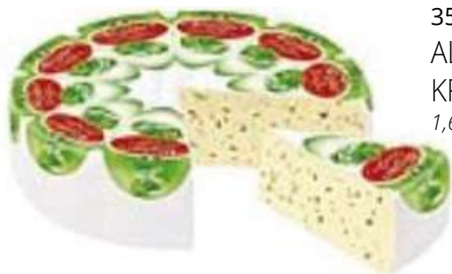
35700 ALLGÄUER RAHMTORTE KRÄUTER 65 % 1,6 kg BFN/Karton