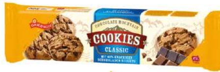
49430 GRIESSON-DE BEUKELAER CHOCO COOKIES 14 Packungen à 150 g/Karton