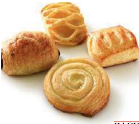
70797 MINI PLUNDER MIX süß, Apfel / Schoko / Vanille / Quark, TK, 4 x 25 Stück á 42 g/Karton