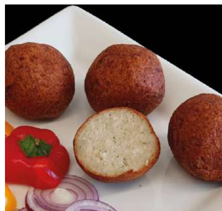
72232 GEFLÜGELBÄLLCHEN TK, gegart, ca. 125 x 40 g, 5 kg/Karton