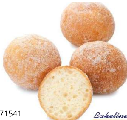
71541 MINI BUTTERMILCH- BÄLLCHEN TK, 111 Stück á ca. 18 g/Karton