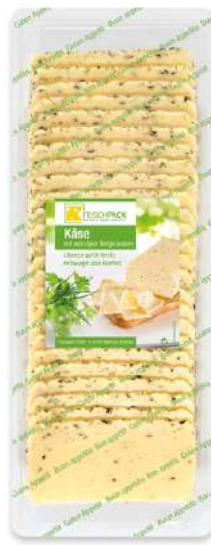
36048 KÄSE BERG- KRÄUTER 55% Scheiben, 500 g/Packung