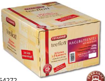
54272 HAGEBUTTENTEE MIT HIBISCUS KETT.5 ER, 30 Stück/Karton