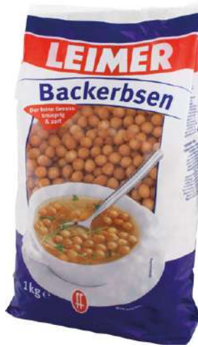
7932 BACK- ERBSEN 4 Packungen à 1 kg/Karton