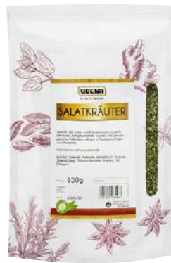
44603 SALATKRÄUTER Zipbeutel, 350 g/Packung UBENA