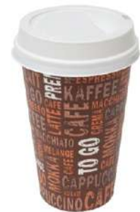
63890 KAFFEEBECHER Coffee Collection, 300 ml, 12 oz, Pappe, 50 Stück/Paket