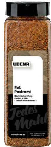
47648 PASTRAMI RUB 580 g/Dose UBENA