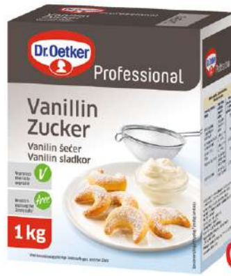
15015 VANILLIN ZUCKER o.d.Z./o.d.A., 1 kg/Paket