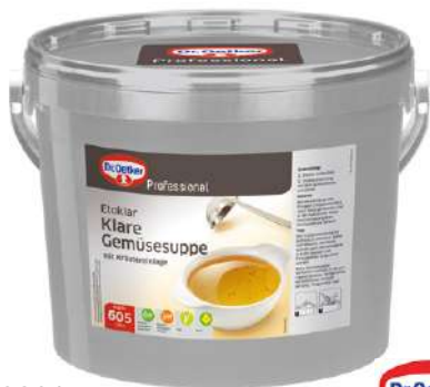
12301 KLARE GEMÜSESUPPE o.d.Z./o.d.A. mit Petersilie 12 kg/Eimer