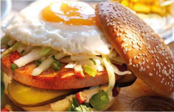
71363 HAMBURGER BUN SESAM TK, 100 mm, 48 x 57 g/Karton