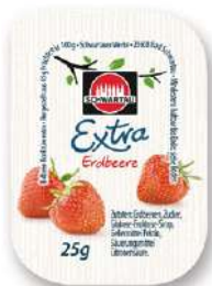
59400 ERDBEER KONFITÜRE EXTRA o.d.Z./o.d.A. 100 x 25 g/Karton