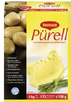
12618 KOMPLETTPÜREE m. entr. Milch, OK, 4 kg/Packung