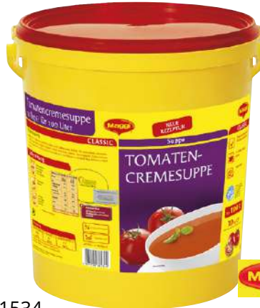
11534 TOMATENCREMESUPPE vegetarisch, OK, 10 kg/Eimer