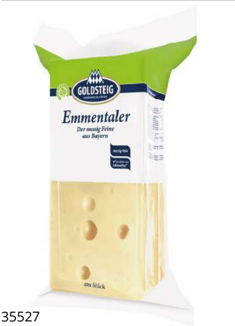
35527 EMMENTALER 45 % Brote, 5,25 kg BFN/Karton