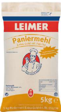
1479 PANIERMEHL EXTRA-GOLD 5 kg/Sack