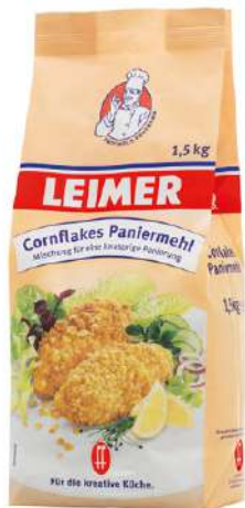
7826 PANIERMEHL CORNFLAKES 1,5 kg/Packung