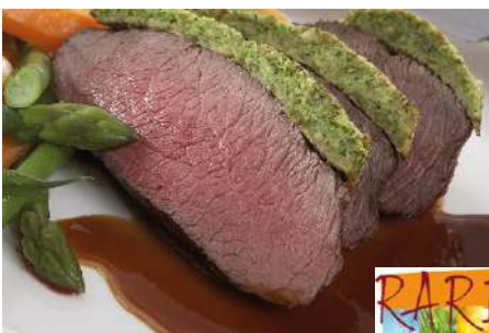
70299 HIRSCHKEULE TK, ohne Knochen, ca. 17 kg/Karton