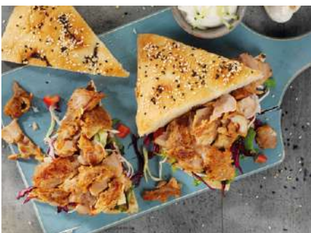
70538 HÄHNCHENFLEISCH KEBAB ART gegart, TK, 2 x 1,25 kg/Karton