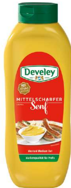
35465 SENF DOSIERFLASCHE mittelscharf, 8 x 875 ml/Karton