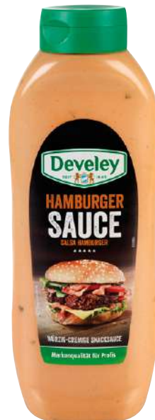
36846 HAMBURGER SAUCE 8 x 875 ml/Karton