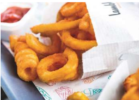
70374 TWISTERS TK, gewürzt D72, 4 x 2,5 kg/Karton