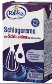
17484 CREMEFINE SCHLAGCREME 31% auf Pflanzenfettbasis o.d.Z., 12 x 1 Ltr./Karton