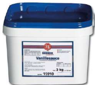
15910 VANILLESAUCE INSTANT 2 kg/Packung