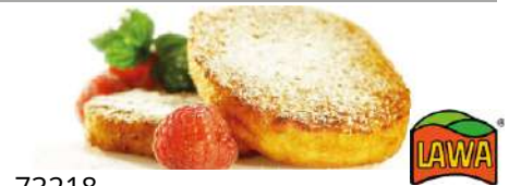
73218 BELFROST QUARKKEULCHEN TK, vorgebacken, 100 x ca.100 g/Karton