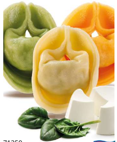
71359 TORTELLINI TRICOLORE RICOTTA E SPINACI TK, vegetarisch, vorgekocht, 10 kg/Karton