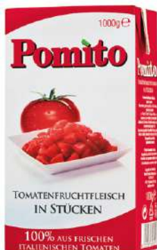
36766 POMITO STÜCKIGE TOMATEN 12 Packungen á 1 kg/Karton