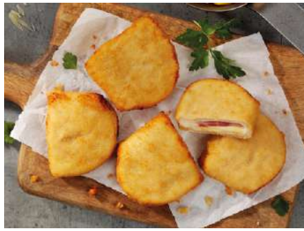
70673 HÄHNCHEN-SCHNITTE CORDON BLEU paniert, gegart, TK, 24 x ca. 125 g/Karton