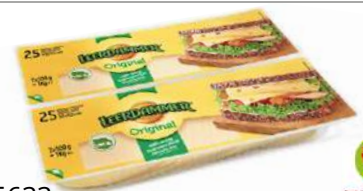
35633 LEERDAMMER 45% SCHEIBEN 5 x 1 kg/Karton