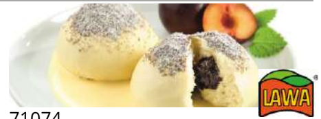
71074 BELFROST GERMKNÖDEL TK, Pflaumenmus, 30 x 170 g/Karton