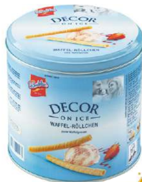
4971 HOHLHIPPEN / WAFFELRÖLLCHEN 100 Stück/300 g Dose