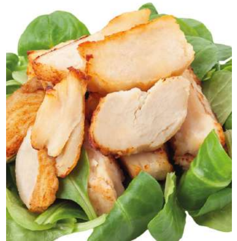
71757 HÄHNCHENBRUST STREIFEN TK, gebraten, geschnitten IQF, 2 x 2,5 kg/Karton