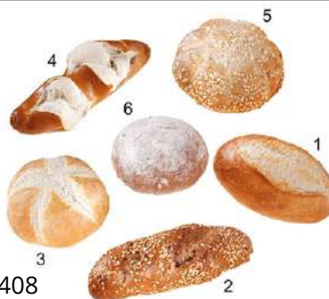
71408 BIO-GOURMET- FRÜHSTÜCKS-MIX 6-fach sortiert, fertig gebacken, TK, 180 x 35 g/Karton