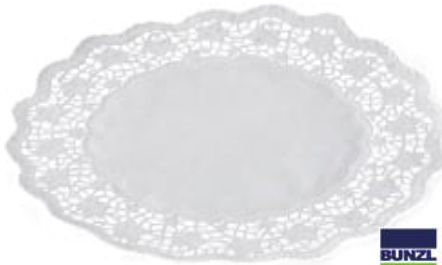
63733 TORTENSPITZEN weiß, 18 cm, rund, 250 Stück/Paket