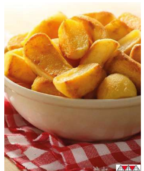
32737 HOME MADE POTATOES vorgegart, 6 x 2 kg/Karton