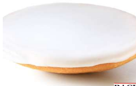
76904 AMERIKANER TK, fertig gebacken, glasiert, m. Fondant (26 %), 42 x 110 g/Karton