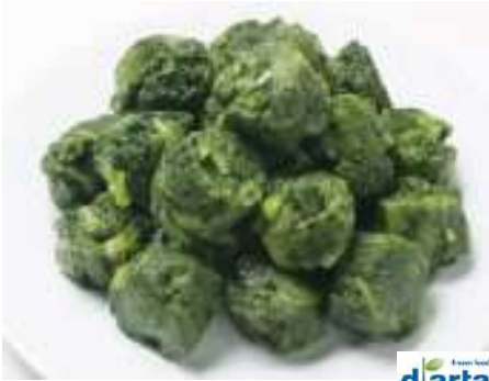
70096 MANGOLD PORTIONIERT TK, halalfähig, 4 x 2,5 kg/Karton