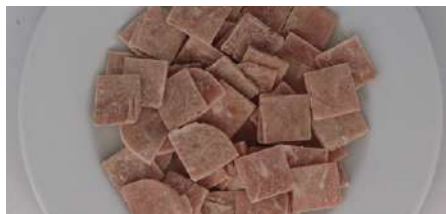
71406 TOPINO HAM STAMPS 1 1 TK, 90%, IQF, 10 x 1 kg/Karton