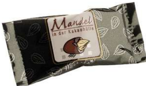
49037 MANDEL IN KAKAOHÜLLE €/Stk. 380 x 2,3 g/Karton 0,045