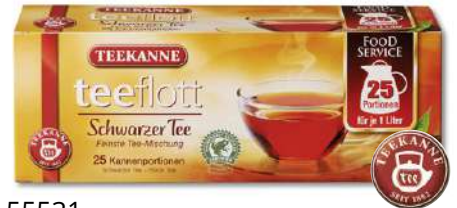
55531 TEEFLOTT SCHWARZER TEE 25 x 1Ltr. Kanne, 16 Stück/Karton