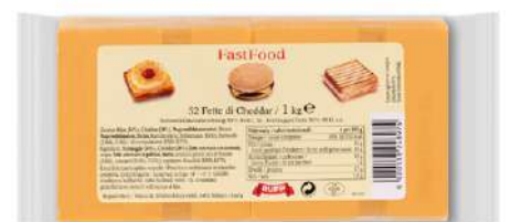
36072 CHESTER FAST FOOD 30% Scheiben, 1 kg/Packung