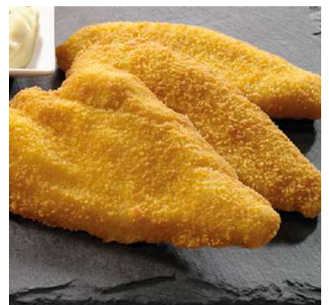
71952 SCHOLLENFILET TK, paniert, vorgegart, 160 - 180 g, nachhaltiger Fang, 5 kg/Karton