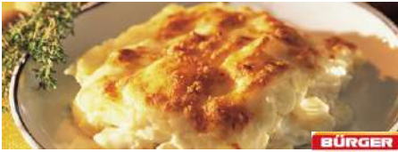
70981 KARTOFFELGRATIN TK, 5 x 2 kg/Karton