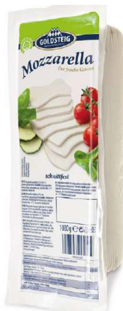
35553 MOZZARELLA 45 % 5 x 1 kg Rolle/Karton