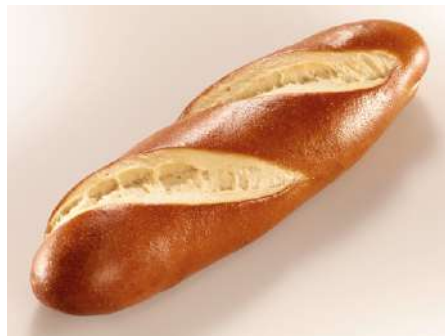
71386 LAUGENSTANGE TK, fertig gebacken, 60 x 70 g/Karton