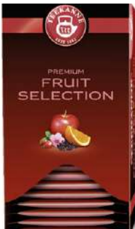
54535 PREMIUM FRUIT SELECTION 10 x 20 Stück/Karton