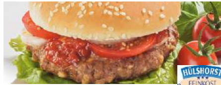
70613 BURGER 75 % Rindfleisch m. TK, Zwiebeln, gebr., 25 x 130 g/Karton