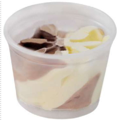
71438 VANILLE SCHOKO BECHER TK, 36 x 80 ml/Karton