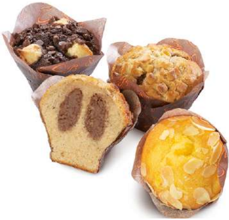
70601 MUFFIN MIX PREMIUM TK, 60 Stück á 45 g/ Karton