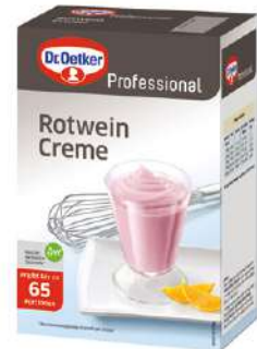
15400 ROTWEINCREME o. Kochen, o.d.Z., 1 kg/Paket