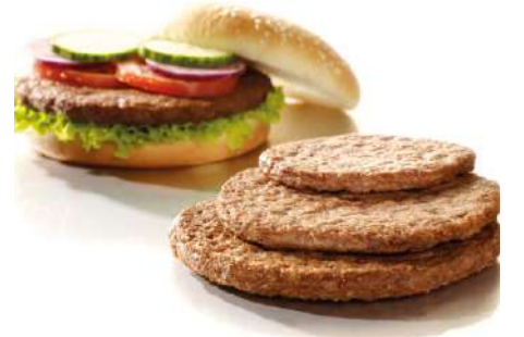
70616 HAMBURGER TK, Rindfleisch, roh, 50 x 100 g/Karton