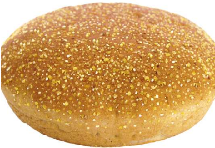
71610 HAMBURGER BRÖTCHEN VOLLKORN TK, 125 mm, 24 x 100 g/Karton