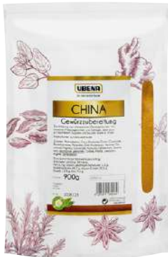
44583 CHINAGEWÜRZ Zipbeutel, 900 g/Packung UBENA