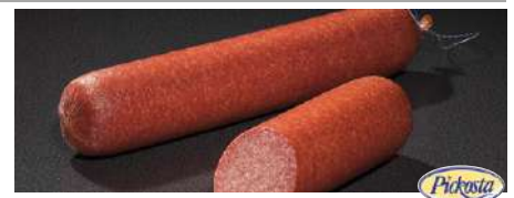
34356 SALAMI braun, geräuchert, Kal. 80, ca. 2,2 kg/Stück