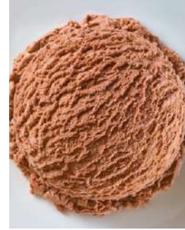
72418 SCHOKOLADEN EIS TK, 5 Liter/Wanne