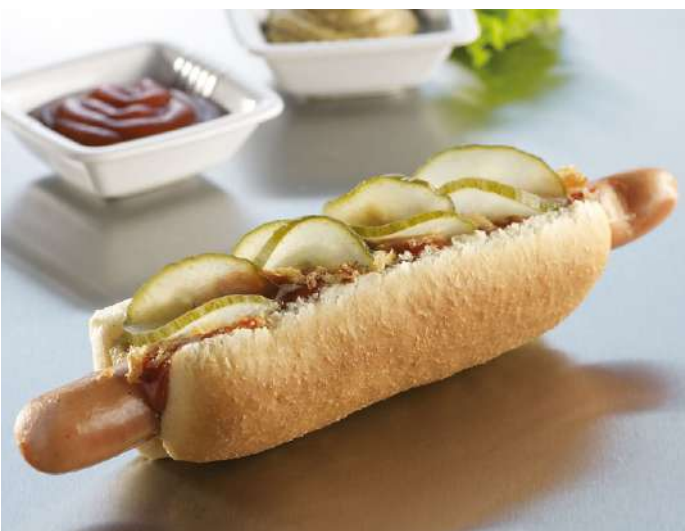
73226 HOT-DOG-BRÖTCHEN gebacken, geschnitten, TK, 128 x 40 g, 8 x 16 Stück/Karton