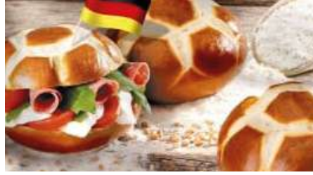
71052 LAUGEN-FUSSBALL- BRÖTCHEN fertig gebacken, TK, 60 x ca. 70 g/Karton