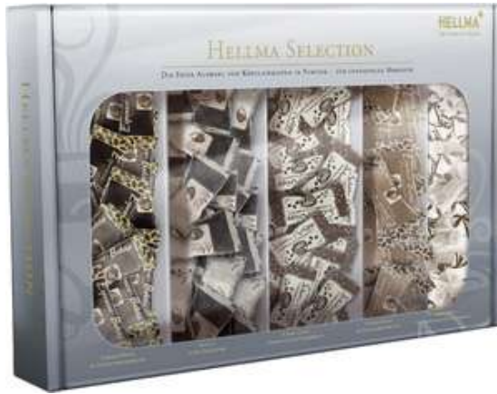
49036 HELLMA SELECTION PORTION Esp. Bohnen, Mandel, Schoko-Krispy 5 x 40 Stück/Karton