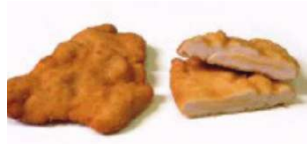
72170 HÄHNCHEN CORDON BLEU TK, gegart, ca. 22 x 140 g/Karton