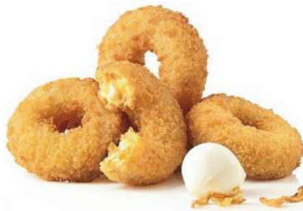
70807 MOZZARELLA ONION RINGS TK, 6 x 1 kg/Karton