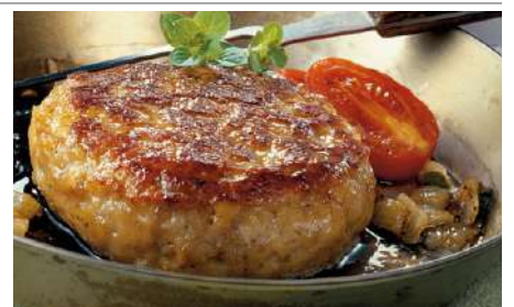
73311 BELFROST FRIKADELLE 150 g, vorgebraten TK, Schweinefleisch, 40 Stk./Karton