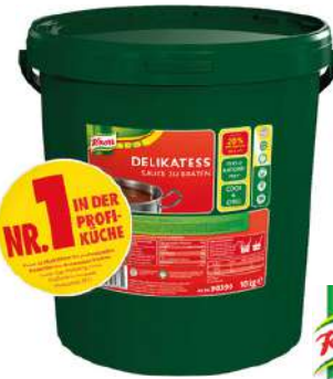
13511 DELIKATESSE SAUCE ZU BRATEN o.d.Z. 10 kg/Eimer