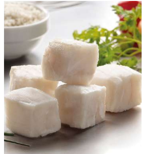
71908 ALASKA-SEELACHS TK, Würfel 20 x 20 x 20 mm, nachhaltiger Fang, 5 kg/Karton