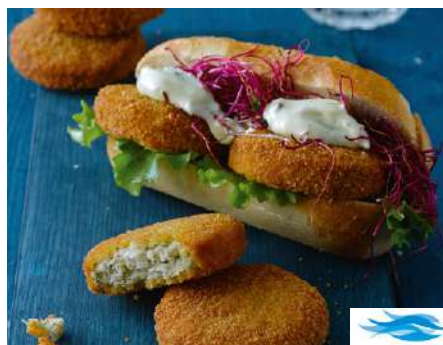
71050 FISCHFRIKADELLE TK, paniert, 4 x 20 x 75 g/Karton