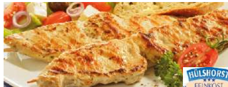
70546 SOUVLAKI TK, roh, Schwein, 30 x 150 g/Karton