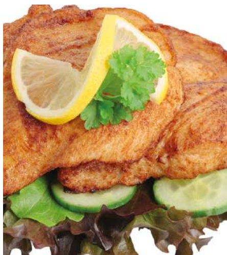
71414 HÄHNCHENBRUSTFILET TK, natur, fertig gebraten, ca. 63 Stk. à 80 g, 5 kg/Karton