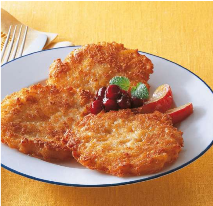
70365 KARTOFFEL REIBEKUCHEN TK, ca. 60 g/Stück, 2 x 50 Stück/Karton