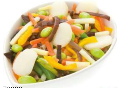
73000 INDONESISCHE WOKMISCHUNG TK, 4 x 2,5 kg/Karton