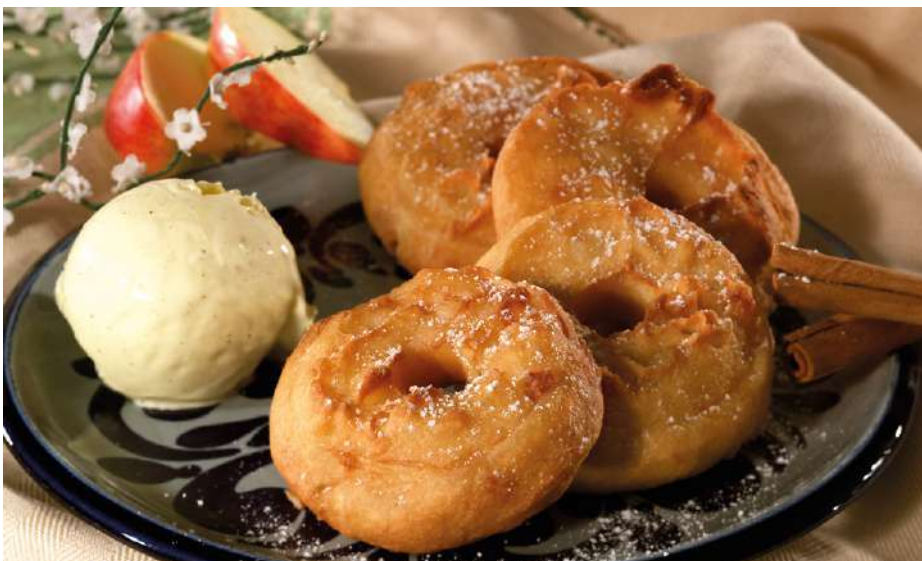
71233 APFELKÜCHLE vorgebacken, TK, 50 g/Stk., 5 Beutel á 1000 g, 5 kg/Karton