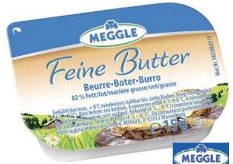
28147 BUTTER MEGGLE in der Schale, 100 x 15 g/Karton