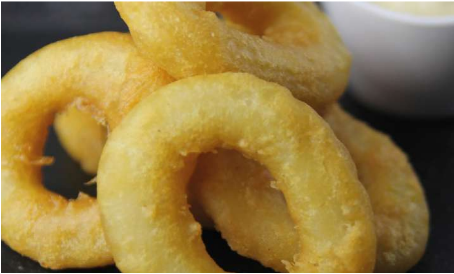
70230 TINTENFISCHRINGE TK, Calamari, paniert, 40 % Fisch, 4 x 2 kg/Karton