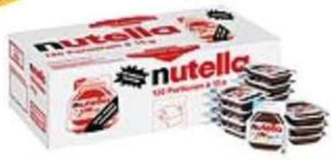
59414 NUTELLA NUSS-NOUGAT-CREME €/BE 120 Becher á 15 g/Karton 0,179