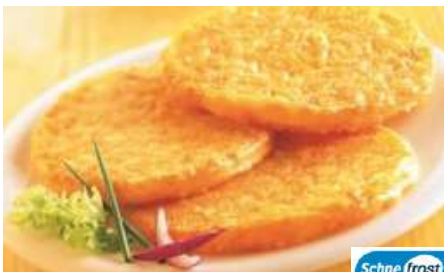
70367 RÖSTI SCHWEIZER ART TK, ca. 120 g/Stück, 2 x 2,5 kg/Karton