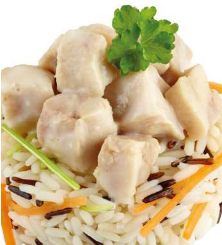
71053 HÄHNCHENFLEISCH gekocht, gewürfelt, Brust und Keule, TK, IQF, 20 mm, 10 kg/Karton