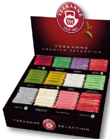
54537 TEEKANNE PREMIUM SORTIMENT Gastro Box, 180 Stück/Karton