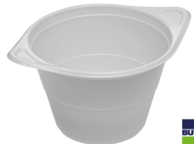
63853 SUPPENTASSE 250 ml, mit Griff, 100 Stück/Paket