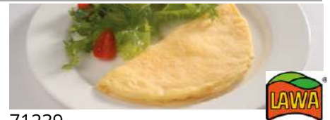
71239 EIEROMELETTE NATUR TK, 50 x 135 g/Karton