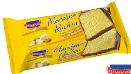
45682 MARZIPAN KUCHEN 6 x 400 g/Karton