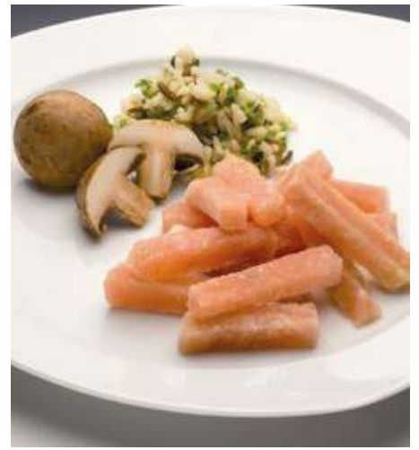
71742 PUTENGESCHNETZELTES TK, Brust, roh, 10 x 10 x 60 mm, IQF, Halal, 2 x 2,5 kg/Karton