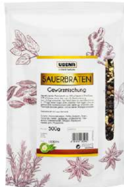
44604 SAUERBRATENGEWÜRZ Zipbeutel, 500 g/Packung UBENA