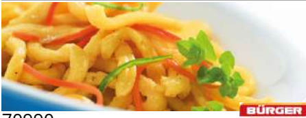
70990 SCHWÄBISCHE EIER- SPÄTZLE TK, 2 x 2,5 kg/Karton