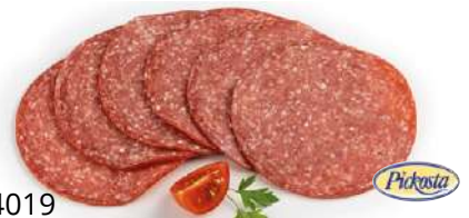
34019 RINDERSALAMI Kal. 80, geschnitten, 500 g/Packung