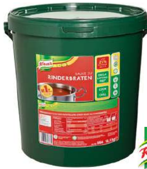
13504 RINDER- BRATEN SAUCE o.d.Z. 12,5 kg/Eimer