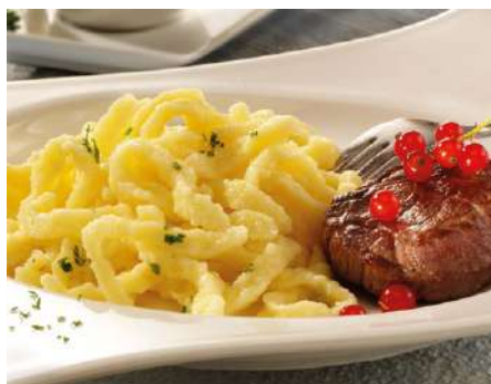
32719 EIERSPÄTZLE frisch geschabt, gegart, mit Eiern aus Bodenhaltung, 2,5 kg/Beutel