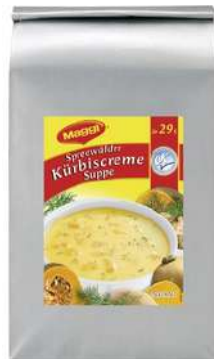
12248 SPREEWÄLDER KÜRBISCREMESUPPE vegetarisch, OK, 2 x 3 kg/Karton