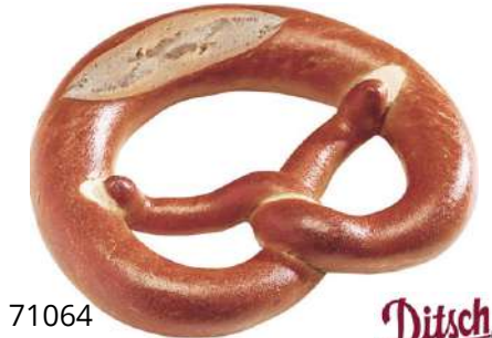
71064 LAUGENBREZEL- BUTTERFÜLLUNG TK, fertig gebacken, 48 x 79 g/Karton