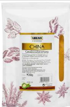
44587 GYROS-GEWÜRZSALZ Zipbeutel, 1300 g/Packung UBENA