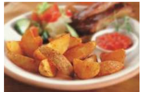
70380 SPICY JACKET WEDGES gewürzt, halalfähig, TK, 4 x 2,5 kg/Karton