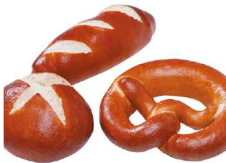
71600 LAUGEN MINI MIX TK, Stange/Brezel/Brötchen, fertig gebacken, 90 x 40 g/Karton