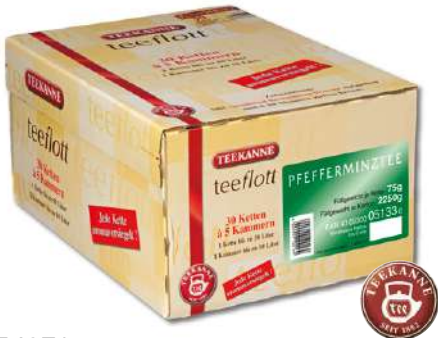
54271 PFEFFERMINZTEE KETT.5 ER, 30 Stück/Karton