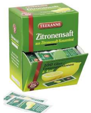
80716 ZITRONEN- SAFT 100 x 4 ml/Karton