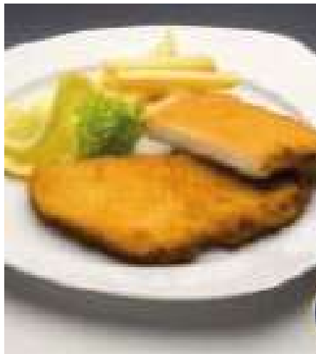
71409 HÄHNCHENBRUSTFILET TK, paniert, gegart, ca. 80 g/Stk. 3 kg/Karton