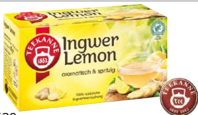
54539 INGWER LEMONTEE 12 x 20 Stück/Karton