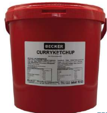
36851 CURRYKETCHUP 10 kg/Eimer