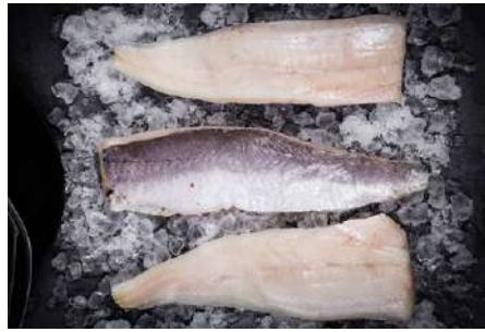
70420 KAP-SEEHECHTFILET 170 - 230 g mit Haut, TK, 5 kg/Karton