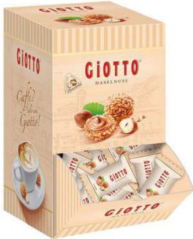
49014 GIOTTO EINZELPORTIONEN €/KT 120 Stück/Karton 11,99