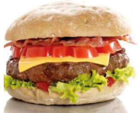
70436 ANGUS BURGER TK, Rindfleisch, roh, 35 x 180 g/Karton