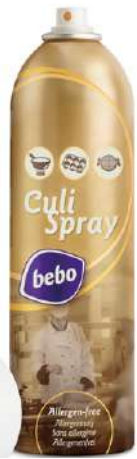
27988 BEBO TRENNSPRAY- CULISPRAY 500 ml/Dose