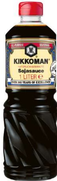
36892 KIKKOMAN SOJA SAUCE 6 x 1 Ltr. PET/Karton