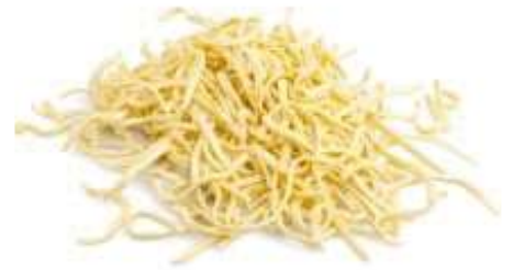
9700 FRISCHEI SPÄTZLE 5 kg/Karton