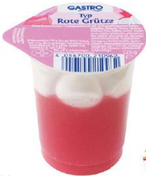
28133 ROTE GRÜTZE MIT SAHNE 24 Becher à 125 g/Karton