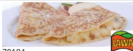
70184 PFANNKUCHEN Apfel-Rosinen, TK, 1 x gefaltet, 30 x 150 g/Karton