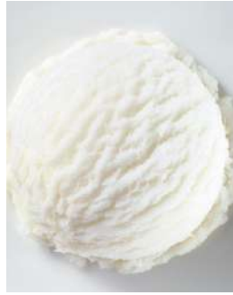
72415 ZITRONEN EIS TK, 5 Liter/Wanne