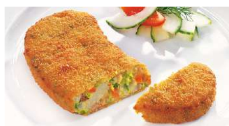
71354 GEMÜSE KNUSPER- SCHNITZEL TK, vorfrittiert, 30 x ca. 145 g/Karton