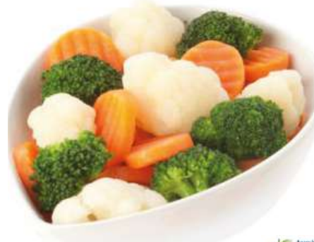
71202 KAISERGEMÜSE TK, 4 x 2,5 kg/Karton