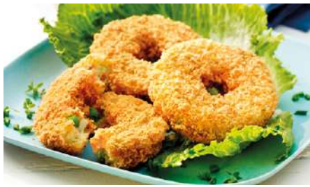
71342 GEMÜSE- KNUSPERBAGEL paniert, TK, vorfrittiert, 40 x ca. 80 g/Karton