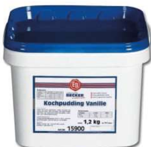
15900 KOCHPUDDING VANILLE 1,2 kg zsS/Packung