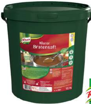
13512 KLARER BRATEN- SAFT o.d.Z. 12,5 kg/Eimer