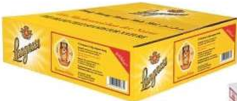
58517 LANGNESE SOMMERBLÜTENHONIG KLAR €/BE o.d.Z./o.d.A. , 72 Becher á 20 g/Karton 0,249