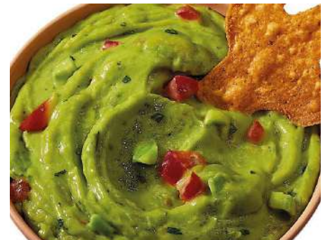
71070 GUACAMOLE CLASSIC SUPREME TK, 12 x 500 g/Karton