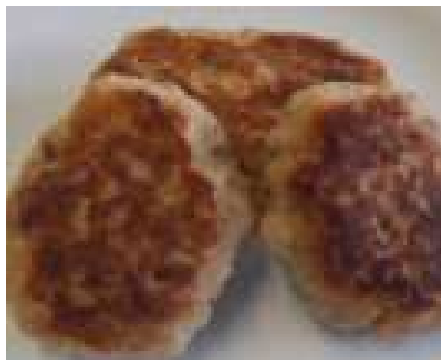
74491 PARTY GEFLÜGEL- FRIKADELLE TK, 25 g/Stück, 2 x 3 kg/Karton