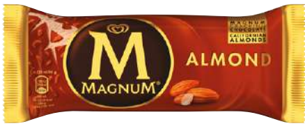
71144 MAGNUM MANDEL TK, 20 x 120 ml/Karton