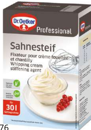
15076 SAHNESTEIF o.d.Z./o.d.A., 1 kg/Paket