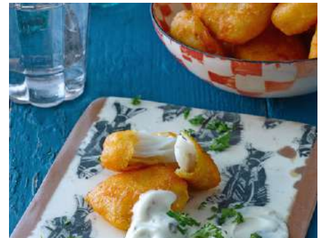
71832 KIBBELINGE IM BACKTEIG TK, Alaska-Seelachs, NF, vorgebraten, 20 - 25 g/Stk., 3 kg/Karton