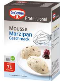
15399 MOUSSE MARZIPAN o.d.Z., 1 kg/Paket