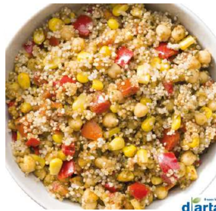
72209 SALAT DJERBA TK, 8 x 1,25 kg/Karton