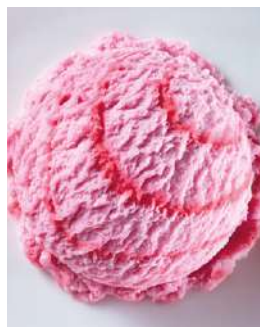
72417 ERDBEER EIS TK, 5 Liter/Wanne