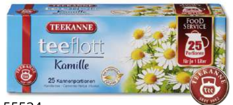
55534 TEEFLOTT KAMILLE 25 x 1Ltr. Kanne, 16 Stück/Karton