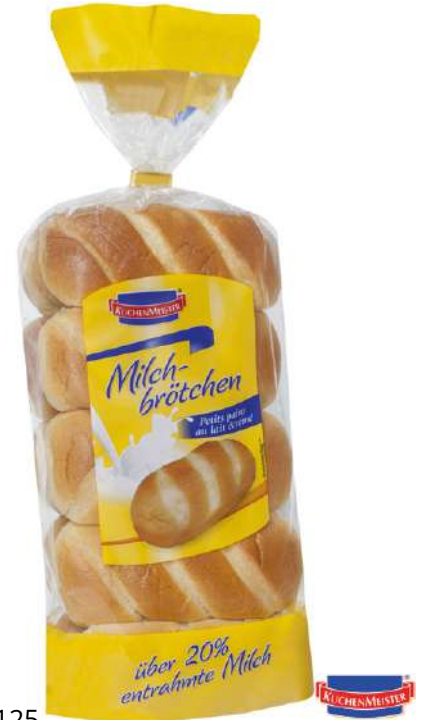
47125 MILCHBRÖTCHEN 7 x 10 Stück à 400 g/Karton