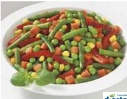
70112 BALKANGEMÜSE/MEXICO MIX TK, 4 x 2,5 kg/Karton