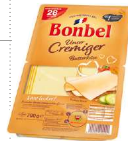
35619 BONBEL 50% SCHEIBEN 3 Packungen à 700 g/Karton