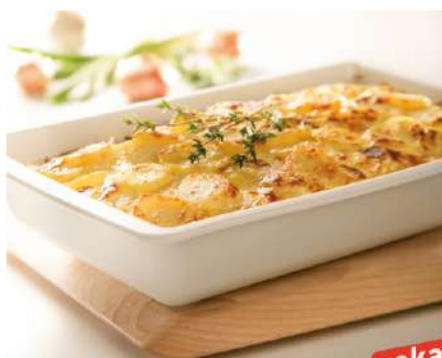
30029 KARTOFFELGRATIN vorgegart, 6 x 2 kg/Karton