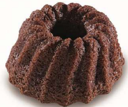
71828 MINI GUGELHUPF SCHOKO TK, 48 Stück á ca. 40 g/Karton