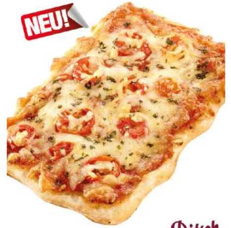
72247 PREMIUM PIZZA-SCHNITTE CAPRESE Teigling, vorgegärt, TK, 2 x 12 Stk. à 205 g/Karton