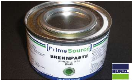
19319 BRENN-PASTE 72 Dosen á 185 g/Karton