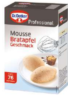
15395 MOUSSE BRATAPFEL o.d.Z., 1 kg/Paket