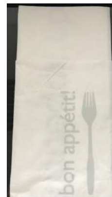
64007 BESTECKTASCHE SERVIETTE TORK Schriftzug: Bon Appetit, 40 x 40 cm, 200 Stück/Paket