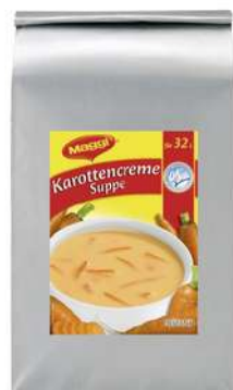
12266 KAROTTEN- CREMESUPPE vegetarisch, OK, 2 x 3 kg/Karton