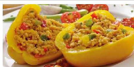
71530 PAPRIKA GELB GEFÜLLT MIT COUSCOUS halbiert, TK, vegan, roh, 50 x 100 g/Karton