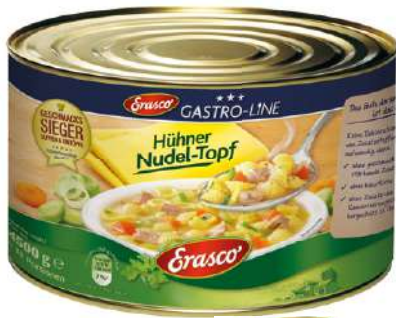
35057 HÜHNER NUDELTOPF 1 Dose 5/1