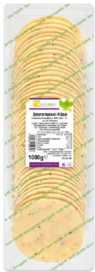
36028 BRENNNESSEL- KÄSE 50% Scheiben 10 cm, 1 kg/Packung