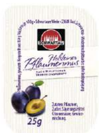
59412 HOLSTEINER PFLAUMENMUS o.d.Z./o.d.A. 100 x 25 g/Karton