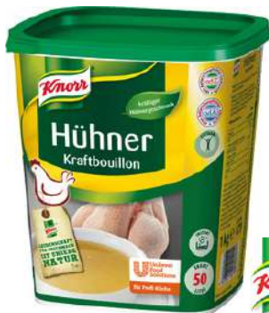
13479 HÜHNER- KRAFT- BOUILLON o.d.Z./o.d.A., 1 kg/Dose