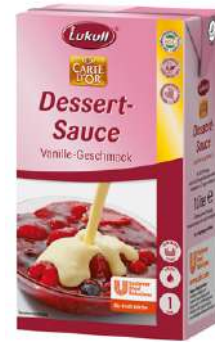
30380 VANILLE SAUCE o.d.Z., m. echter Bourbon-Vanille, 6 x 1 Ltr. /Karton