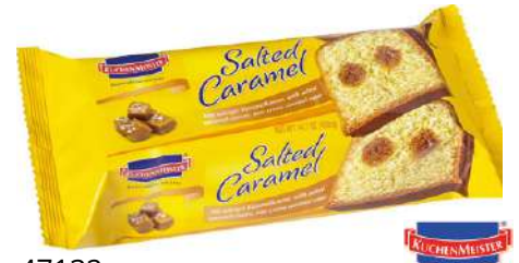
47132 SALTED CARAMEL KUCHEN 6 x 400 g/Karton