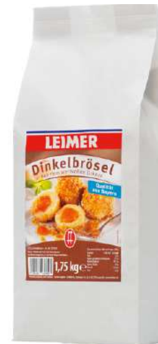
7940 DINKEL- BRÖSEL 1,75 kg/Packung