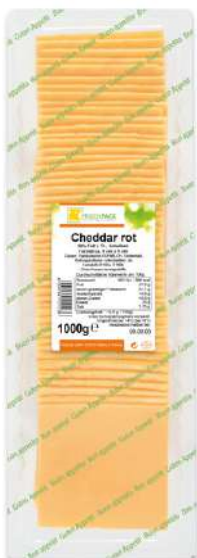
36044 CHEDDAR 50% Scheiben 9 x 9 cm, 1 kg/Packung