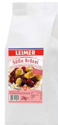
7941 SÜSSE BRÖSEL 2 kg/Packung