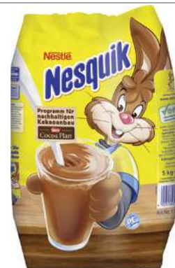
56315 NESQUIK KAKAO vegetarisch, Feingeschmack, OK, 5 kg/Beutel