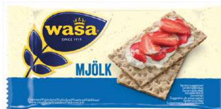
51101 WASA MJÖLK BRÖD €/Stk. 120 x 17 g/Karton 0,149