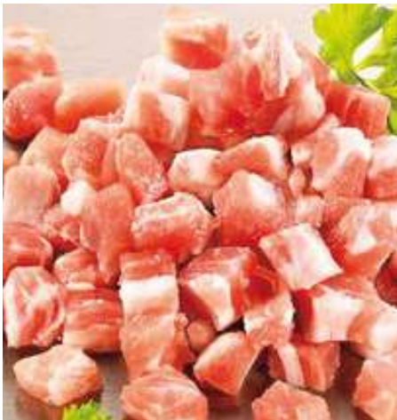
34681 BACON GEWÜRFELT 6 x 6 x 6 mm, 1 kg/Paket