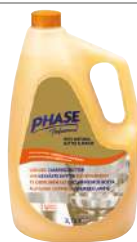
80249 PHASE BUTTER FLAVOUR m. Butteraroma, Beta-Carotin, 3,7 Ltr./Flasche