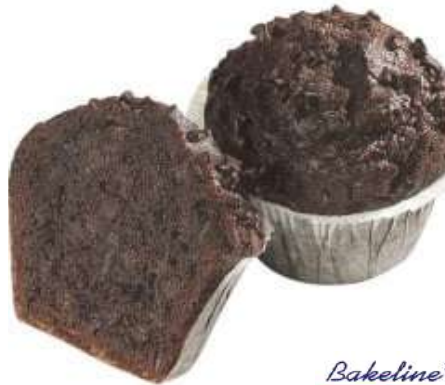
73496 MUFFINS MIT SCHOKO TK, 36 Stück á 75 g/Karton