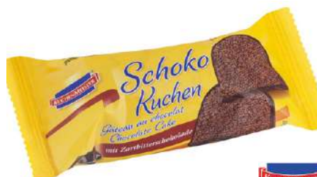
47118 MINI SCHOKO KUCHEN 27 x 35 g/Karton