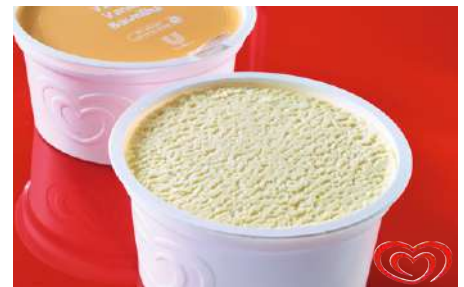
72420 EISBECHER VANILLE TK, 60 x 70 ml/Karton