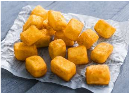
70201 CRISPY CUBES gewürzt Q19, Würfel, halbfähig, TK, 4 x 2,5 kg/Karton