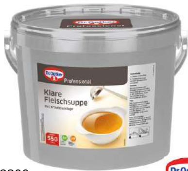
12300 KLARE FLEISCHSUPPE o.d.Z./o.d.A. mit Kräutern 12 kg/Eimer