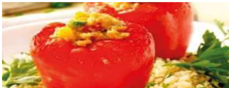
70189 PAPRIKASCHOTE ROT Kombidämpfer geeignet, roh, vegan, TK, gefüllt, 50 Stk. à 200 g/Karton