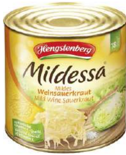
35865 MILDESSA Weinsauerkraut, 3 Dosen á 2530 g/Karton