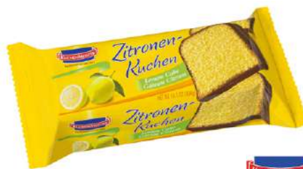
45684 ZITRONEN KUCHEN 6 x 400 g/Karton