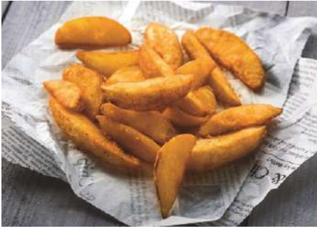
70177 KARTOFFEL WEDGES TK, gewürzt W01, 4 x 2,5 kg/Karton