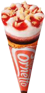
72404 CORNETTO ERDBEER TK, 24 x 120 ml/Karton