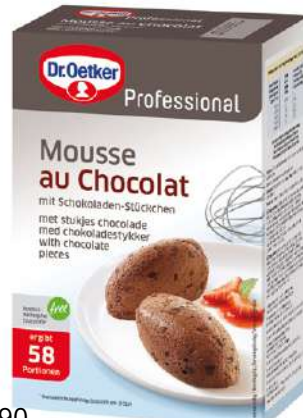
15390 MOUSSE AU CHOCOLAT o.d.Z., 1 kg/Paket