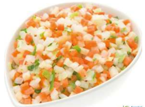
73002 BRUNOISE-MIX TK, 4 x 2,5 kg/Karton