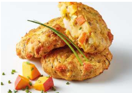
70774 GEMÜSE-FRIKADELLE KÜRBIS-STECKRÜBE vorgebacken 75 g/Stück, TK, 5 kg/Karton