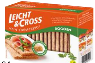
51184 LEICHT&CROSS BROT ROGGEN 8 Pakete à 125 g/Karton