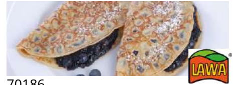
70186 PFANNKUCHEN Heidelbeerfüllung, TK, 1 x gefaltet, 30 x 150 g/Karton