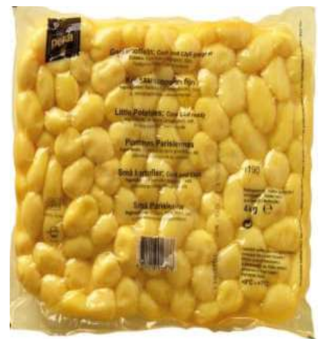
32756 DELIKATES GARKARTOFFELN Original für Cook & Chill, 20/30 mm, 3 x 4 kg/Karton