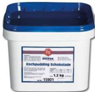
15901 KOCHPUDDING SCHOKOLADE 1,2 kg zsS/Packung