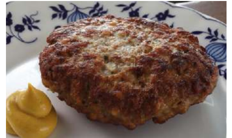
71977 BELFROST FRIKADELLE RUSTIKAL TK, 125 g, vorgebraten, 30 Stk./Karton