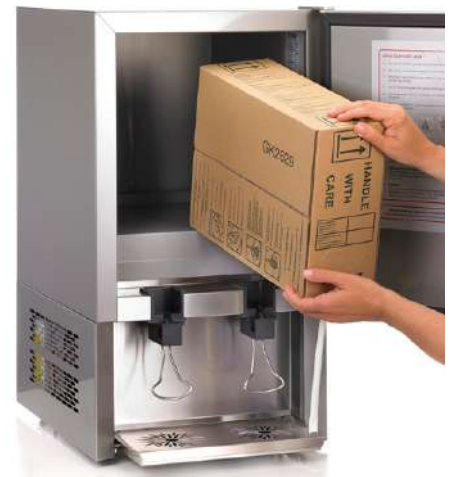
42884 APFELSAFT 100 % für Dispenser, 10 Liter/BIB