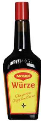
11010 WÜRZE rein pflanzlich, 12 Flaschen à 101 ml/Karton