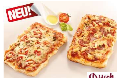
72252 PREMIUM PIZZA-SCHNITTE SALAMI Teigling, vorgegärt, TK, 2 x 12 Stk. à 196 g/Karton