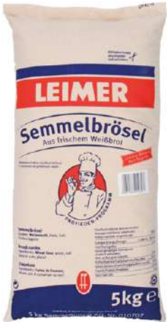
1470 SEMME- BRÖSEL 5 kg/Sack