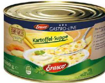
35059 KARTOFFELSUPPE 1 Dose 5/1