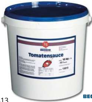
15813 TOMATENSAUCE Granulat, 10 kg ODPZ -A/Eimer