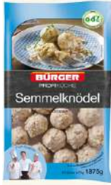
70629 SEMMELEKNÖDEL TK, 100 x ca. 75 g/Karton