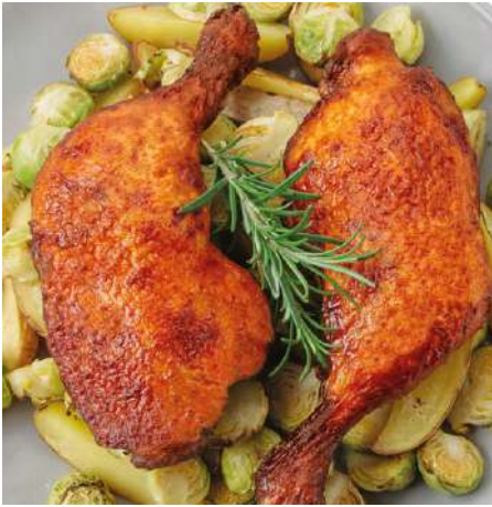
70407 HÄHNCHENSCHENKEL TK, gebraten, ca. 180 g/Stück 5 kg/Karton