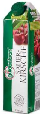
42619 SAUERKIRSCH- NEKTAR 40 % TetraPak mit Schraubverschluss 12 x 1 Ltr./Karton