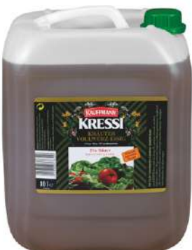
36503 KRESSI KRÄUTERESSIG 5% 10 Ltr./Kanister