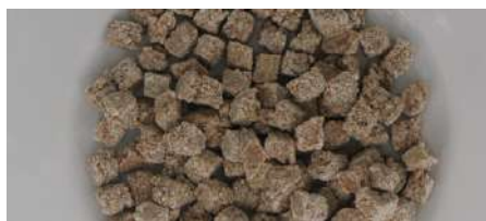
71407 SALIMAH SPICY BEEF CHUNKS Rinderhack. gew. TK, IQF, 10 x 1 kg/Karton