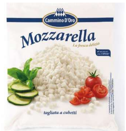
35739 MOZZARELLA 45 % gewürfelt, im Beutel 5 x 5 x 5 mm 4 x 2,5 kg/Karton