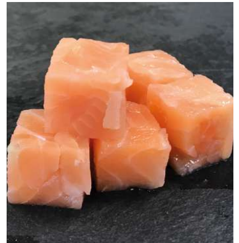
72123 WILDLACHSFILET TK, Würfel 20 x 20 x 20 mm, nachhaltiger Fang, IQF, Farbe 13+, 5 kg/Karton