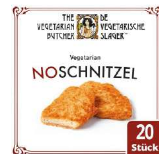
72063 NO SCHNITZEL vegetarisch, paniert, o.d.Z. TK, 20 Stk. à 90 g/Karton