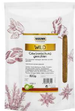
44609 WILDGEWÜRZ gemahlen Zipbeutel, 800 g/Packung UBENA