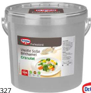
12327 WEISSE SOSSE BECHAMEL Granulat, o.d.Z. 12 kg/Eimer