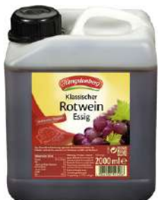
36531 ROTWEINESSIG 6% 2 Liter/Kanister