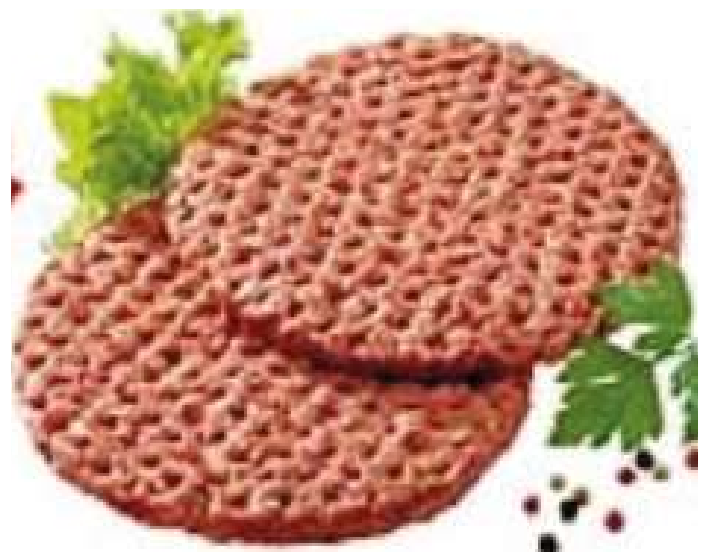
70247 HAMBURGER HITBURGER PLUS TK, roh, 50 x 100 g/Karton