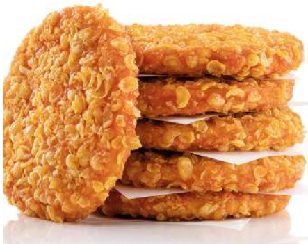
71305 CRUNCHY CHIK'N BURGER TK, gegart, ca. 60 x 90 g, 6 kg/Karton