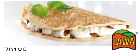
70185 PFANNKUCHEN Quark-Rosinen, TK, 1 x gefaltet, 30 x 150 g/Karton