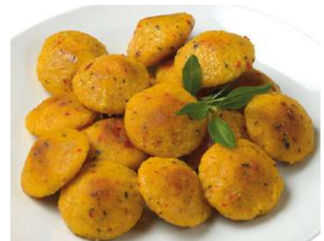
72204 GALETTINI POLENTA MEDITERRAN TK, 2 x 2,5 kg/Karton