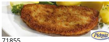
71855 SCHWEINELACHSSCHNITZEL TK, roh, paniert, 50 x 140 g/Karton