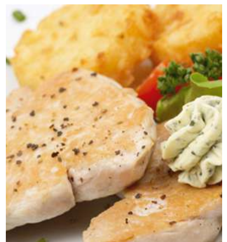
76974 PUTENBRUSTSCHNITZEL TK, natur ungewürzt, 140 g/Stk. IQF, 5 kg/Karton