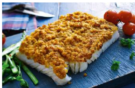
70151 SCHLEMMERFILET BORDELAISE TK, 30 x 200 g/Karton