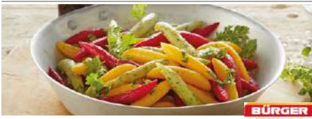
71782 SCHUPFNUDELN TRIO TK, gelb-grün-rot, IQF, 2 x 2,5 kg/Karton