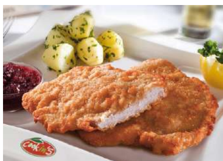
70599 WIENER SCHNITZEL Schwein, gebraten, TK, 30 x ca. 100 g/Karton