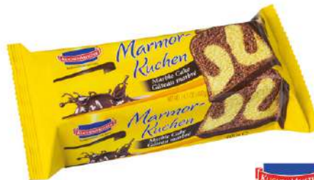
45680 MARMOR KUCHEN 6 x 400 g/Karton