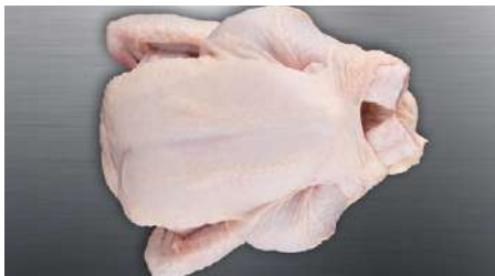
70270 PRIMUS GRILLER TK, 10 x 1000 g/Karton