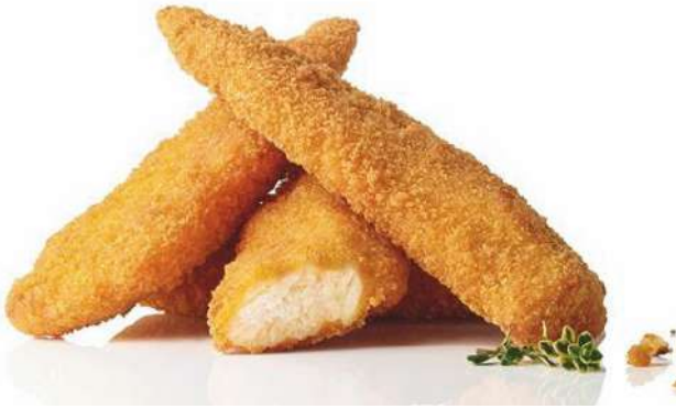
70397 CRISPY CHIK'N FINGERS TK, 5 x 1 kg á ca. 22 - 32 Stück/Beutel