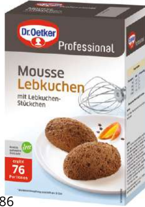
15386 MOUSSE LEBKUCHEN o.d.Z., 1 kg/Paket