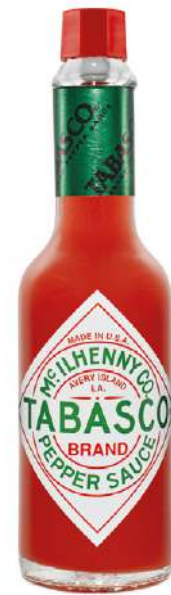
36890 TABASCO ORIGINAL 12 x 57 ml/Karton