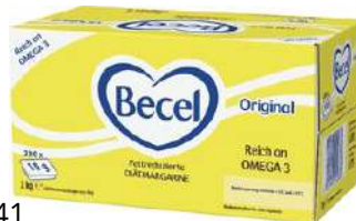
28141 BECEL DIÄT MARGARINE m. Beta-Carotin o.d.A., 200 x 10 g/Karton