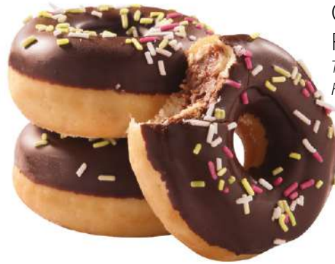
70602 MINI DONUT CHOCOLATE FILLED TK, 135 Stück á 24 g/ Karton