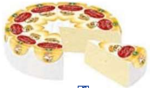
35716 ALLGÄUER RAHMTORTE NATUR 65 % 1,69 kg BFN/Karton