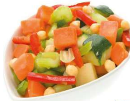
71149 COUSCOUSGEMÜSE TK, 4 x 2,5 kg/Karton