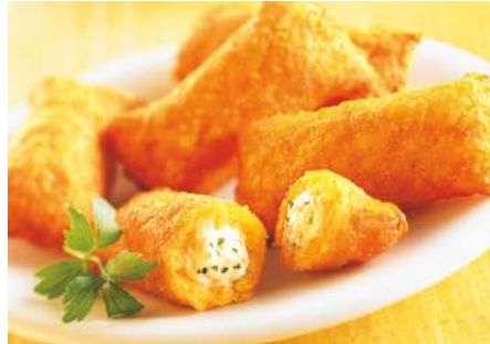
74873 MINI KARTOFFELTASCHEN FRISCHKÄSE-KRÄUTER ca. 25 g/Stück, TK, 5 x 1 kg/Karton