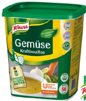
13468 GEMÜSE- KRAFT- BOUILLON o.d.Z./o.d.A., 1 kg/Dose