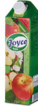
42655 APFELSAFT 100 % TetraPak mit Schraubverschluss 12 x 1 Ltr./Karton