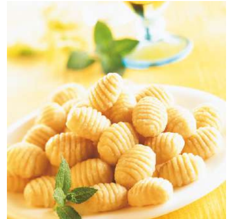
70364 GNOCCHI TK, ca. 8 g/Stück, 2 x 2,5 kg/Karton