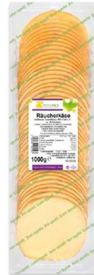
36063 RÄUCHERKÄSE 50% Scheiben 10 x 10 cm, 1 kg/Packung