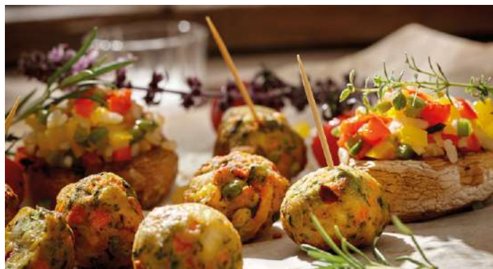
70801 GEMÜSE- KÖTTBULLAR ca. 17 g/Stück, TK, 5 x 1 kg/Karton