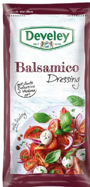
35395 BALSAMICO DRESSING 14 Beutel à 75 ml./Karton