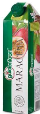
42621 MARACUJA- NEKTAR 25 % TetraPak mit Schraubverschluss 12 x 1 Ltr./Karton