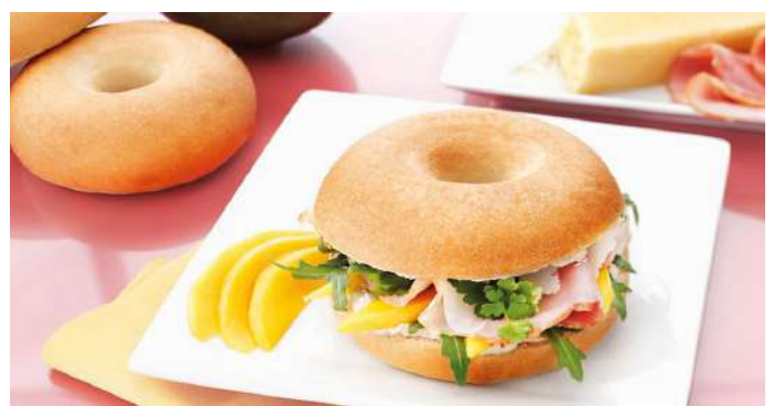
73499 BAGEL NATUR TK, 36 Stück á 75 g/Karton