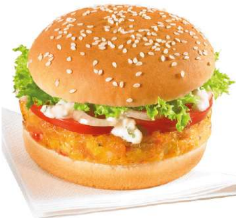
76012 SUNNY VEGGIE BURGER TK, vorgebacken, 40 x ca. 130 g/Karton