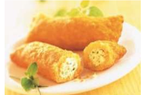
76814 KARTOFFELTASCHE KÄSE&KRÄUTER 66 x ca. 75 g/Stück, TK, 2 x 2,5 kg/Karton