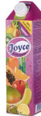
42656 MULTIVITAMIN- NEKTAR 50 % mit Süßungsmittel, TetraPak mit Schraubverschluss 12 x 1 Ltr./Karton