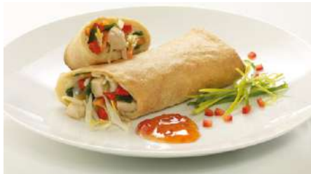
71254 FRÜHLINGSROLLE HÄHNCHEN TK, vorfrittiert, 20 x ca. 150 g/Karton