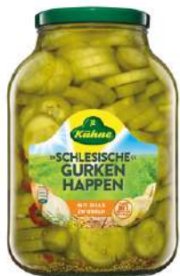
33743 GURKENHAPPEN SCHLESISCH 4 Gläser à 2650 ml/Karton