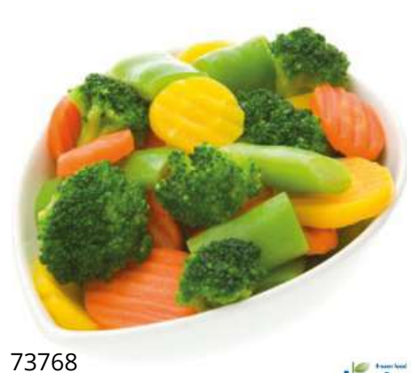
73768 EUROMIX GEMÜSEMISCHUNG TK, 4 x 2,5 kg/Karton