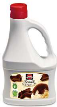
59375 SCHOKOLADEN- SAUCE o.d.Z. 2 kg/Flasche