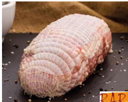
70618 PUTEN-ROLLBRATEN TK, roh, 5 x 2 kg/Karton