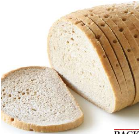
70619 RINDENLOSES WEIZENMISCHBROT TK, geschnitten, 6 x 1 kg/Karton