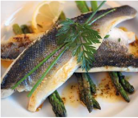
70171 WOLFSBARSCHFILET mit Haut, PBO, 20 % Glasur, 120-160G geschuppt Aquakultur, TK, 5 kg/Karton