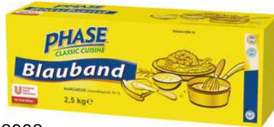
28008 BLAUBAND MARGARINE rein pflanzlich, o.d.Z., o.d.A., 4 x 2,5 kg/Karton