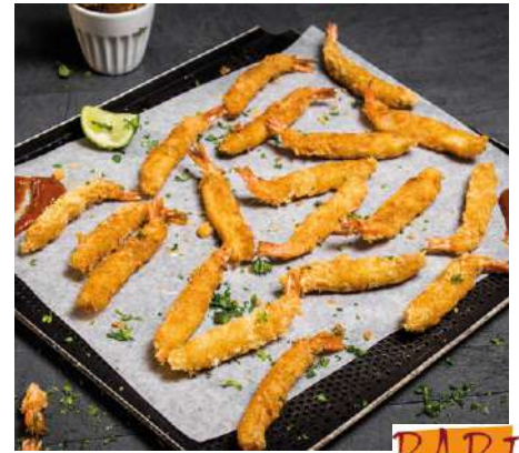
71622 THAI GARNELEN TK, „JAPAN STYLE - TORPEDO“ im Backteig, 26/30 Lbs, 1000 g/Box