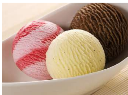
70261 EISKREM VANILLE TK, 5000 ml/Dose