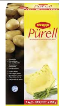
14468 KOMPLETTPÜREE m. entr. Milch, OK, 7 kg/Packung