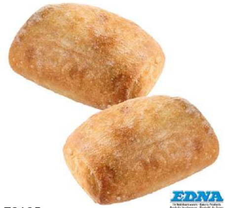
73125 MINI CIABATTA BRÖTCHEN TK, vorgebacken, 70 x 50 g/Karton