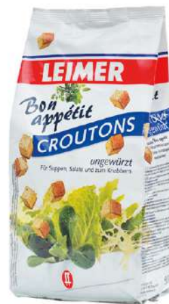
7935 CROUTONS UNGEWÜRZT 5 Packungen à 500 g/Karton