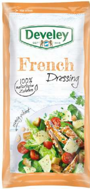
35392 FRENCH DRESSING 14 Beutel à 75 ml./Karton