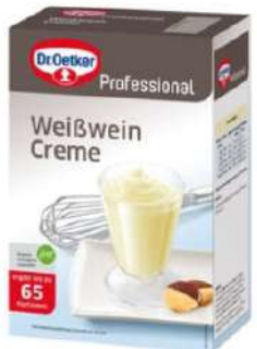
15401 WEISSWEINCREME o. Kochen, o.d.Z., 1 kg/Paket