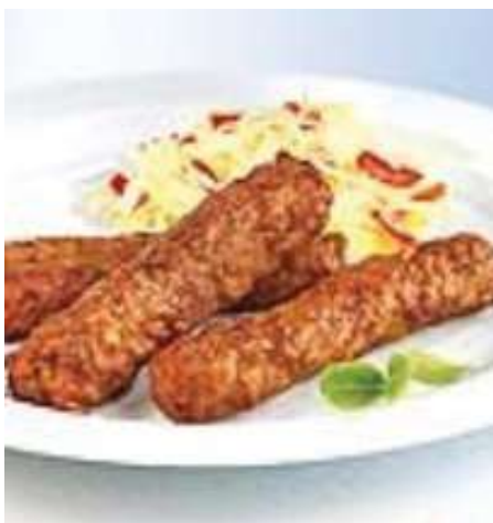
70250 HACKSTEAKRÖLLCHEN BALKAN ART gegart, Schwein, IQF, TK, 256 Stück á 30 g/Karton