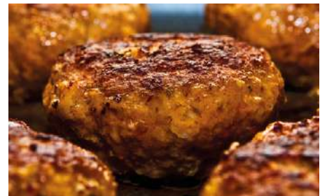
73010 BELFROST FRIKADELLE 200 g, vorgebraten TK, Schweinefleisch, 50 Stk./Karton