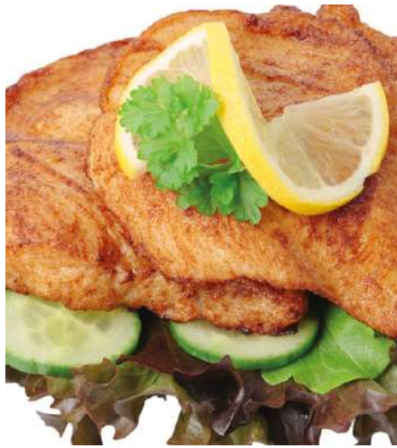
71404 HÄHNCHENBRUSTFILET TK, gebraten, ca. 42 Stk. à 120 g, 5 kg/Karton