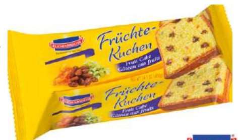
47138 FRÜCHTE KUCHEN 6 x 400 g/Karton