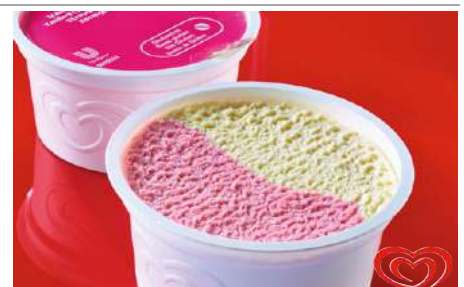
72422 EISBECHER ERDBEER VANILLE TK, 60 x 70 ml/Karton