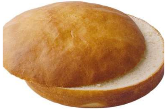
71606 HAMBURGER BRÖTCHEN BRIOCHE STYLE TK, 125 mm, 24 x 110 g/Karton