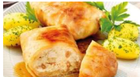
71347 VEG. KOHLROULADE Kombidämpfer geeignet, TK, 50 x 200-220 g/Karton