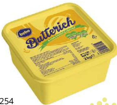
28254 BEBO BUTTERICH MARGARINE 60% m. buttrigem Geschmack, 2 kg/Becher