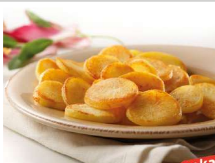
32722 KARTOFFELSCHNITZEN 6 mm, 6 x 2 kg/Karton