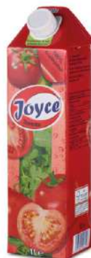
42633 TOMATENSAFT TetraPak mit Schraubverschluss 12 x 1 Ltr./Karton