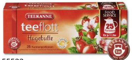
55533 TEEFLOTT HAGEBUTTE 25 x 1Ltr. Kanne, 16 Stück/Karton