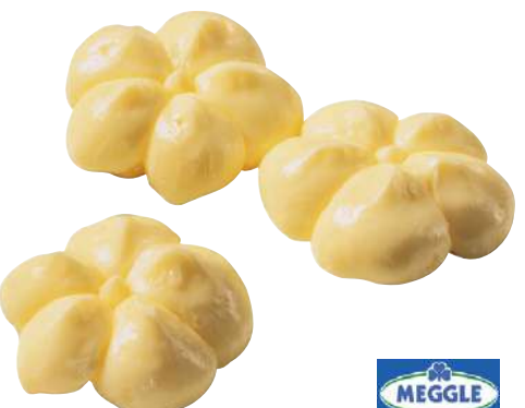
71021 FEINE BUTTER-BLÜTEN TK, 500 x 10 g/Karton