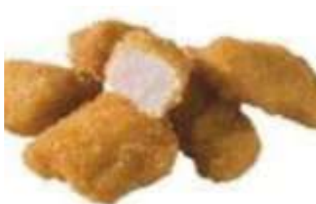
70166 CHICKEN-CROSSIES gegart, wie gewachsen, TK, 120 x 25 g, 3 kg/Karton