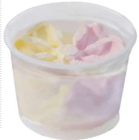
72059 VANILLE ERDBEER BECHER TK, 36 x 80 ml/Karton