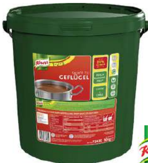
13503 GEFLÜGEL SAUCE o.d.Z./o.d.A., 10 kg/Eimer