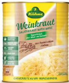
35902 WEINSAUER- KRAUT 10/1 9700g/Dose