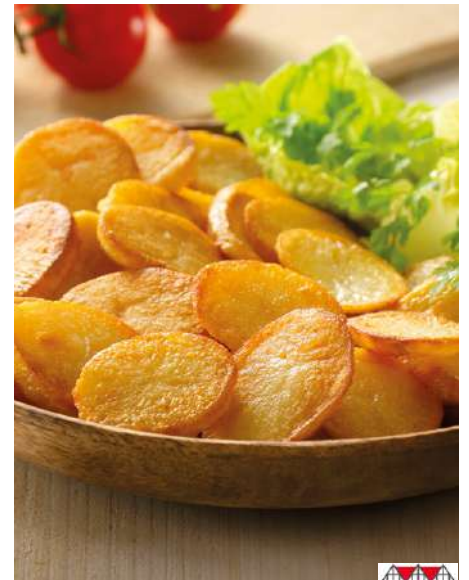
32729 BRATKARTOFFELSCHNITZEN IN ÖL 7 mm, 6 x 2 kg/Karton