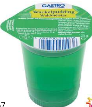
28967 GÖTTERSPEISE Himbeere, Waldmeister, sortiert, 24 Becher à 125 g/Karton