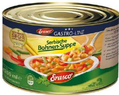
35063 SERBISCHE BOHNEN- SUPPE 1 Dose 5/1