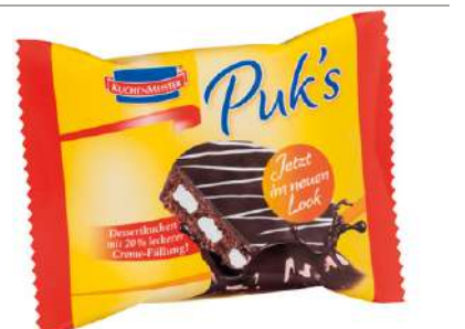
54092 PUKS SCHOKO DESSERTKUCHEN 18 x 62 g/Karton