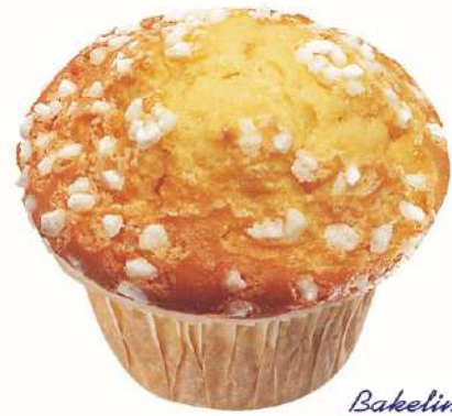
73511 MUFFIN ZITRONE TK, fertig geb., 36 Stück á 75 g/Karton