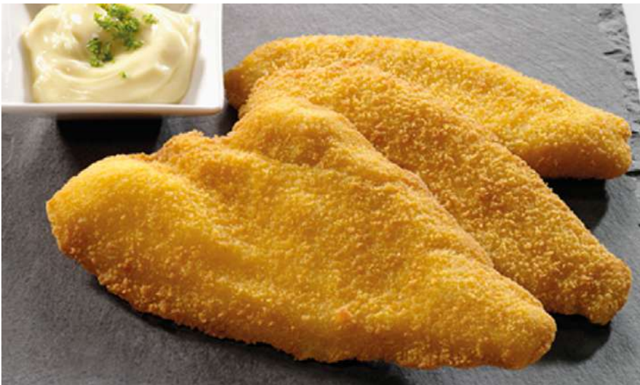
71910 SCHOLLE TK, paniert, vorgebraten, 140 - 160 g, nachhaltiger Fang, 5 kg/Karton