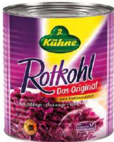
37175 ROTKOHL 10/1 9200g/Dose