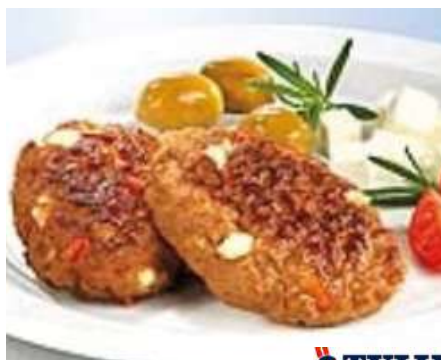
74462 BIFTEKI MIT KÄSE TK, griechische Art, ca. 93 x 65 g, 6 kg/Karton