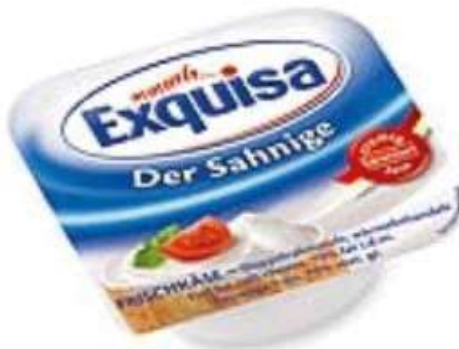
35571 NATUR 70 % 40 x 20 g/Karton