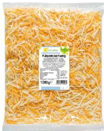
36054 MOZZARELLA CHEDDAR RASPELMIX 40% / 50% TEX MEX, 1 kg/Beutel