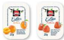
59407 KONFITÜRE SORTIERT EXTRA o.d.Z./o.d.A. 100 x 25 g/Karton