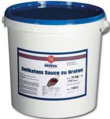
15812 DELIKATESS SAUCE ZU BRATEN 11 kg ODPZ -A/Eimer