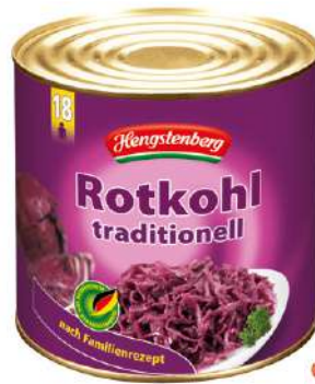
37177 ROTKOHL 3 Dosen á 2400 g/Karton