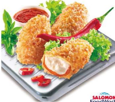
72102 RED HOT JALAPENOS TK, vorgebacken, 6 x 1 kg/Karton