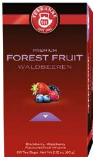
54536 PREMIUM WALDBEEREN 10 x 20 Stück/Karton