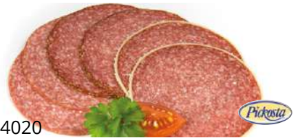
34020 SALAMI AUFSCHNITT 3-fach, Kal 90/95, 500 g/Packung