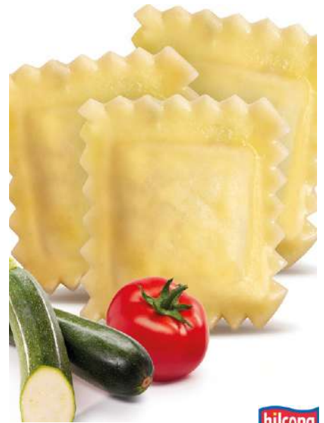
71358 RAVIOLINI VERDURA TK, vegetarisch, vorgekocht, 10 kg/Karton