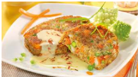
70194 GEMÜSE-VOLLKORN- BRATLINGE roh, TK, 40 x ca. 150 g/Karton