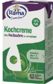
17485 CREMEFINE KOCHCREME 15% auf Pflanzenfettbasis o.d.Z., 12 x 1 Ltr./Karton