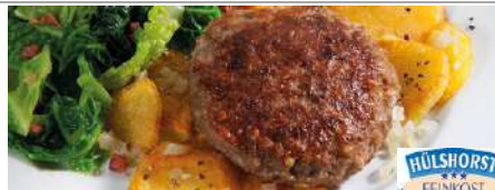
79992 RINDFLEISCH FRIKADELLE TK, gebraten, 30 x 125 g/Karton