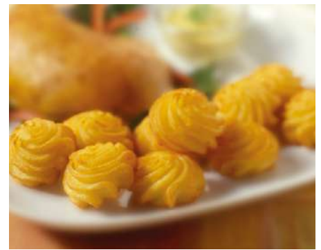
70207 HERZOGIN-KARTOFFELN POM´ DUCHESSE TK, 4 x 2,5 kg/Karton