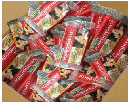
51109 MESTEMACHER VOLLKORNBROT €/Stk. 85 x 50 g/Karton 0,169