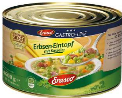
35051 ERBSENEINTOPF 1 Dose 5/1