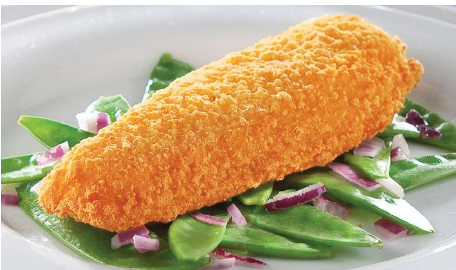
79961 ALASKA SEELACHS KNUSPER TK, fertig gebraten, nachhaltiger Fang, 20 x ca. 120g/Karton