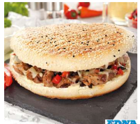
77213 FLADENBROT TK, vorgebacken, 12 x 150 g/Karton