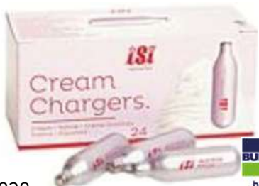
28828 SAHNE-KAPSELN EW 50 Stück/Karton