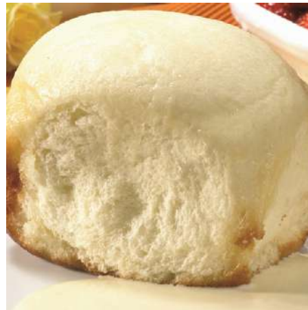
71079 DAMPF-NUDELN TK, ungefüllt, mit Kruste, 18 x 180 g/Karton