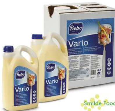
28338 VARIO 5 Liter/Kanister