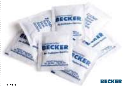
121 ZUCKERBRIEFCHEN 2000 Briefchen/Karton