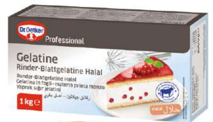
16028 RINDER BLATTGELATINE o.d.Z./o.d.A., 1 kg/Paket