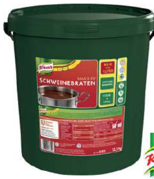
13502 SCHWEINE- BRATEN SAUCE o.d.Z. 12,5 kg/Eimer