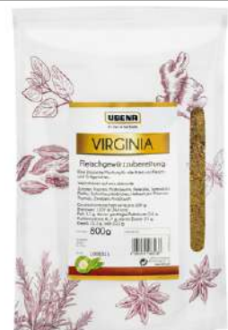
44618 VIRGINIA FLEISCHGEWÜRZ Zipbeutel, 800 g/Packung UBENA