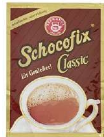
59518 TRINK- SCHOKOLADE SCHOCOFIX 50 Beutel à 25 g/Karton