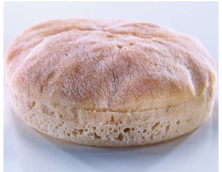
71770 RUSTIKAL BURGER BUN TK, 125 mm, 24 x 105 g/Karton