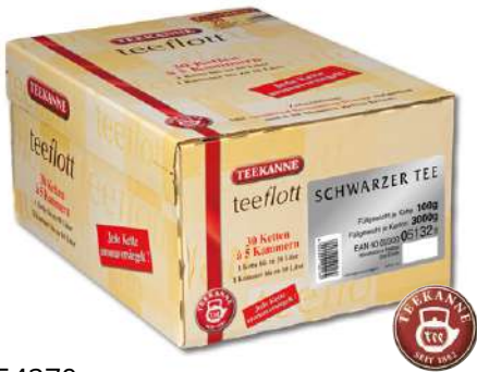
54270 SCHWARZER TEE KETT.5 ER, 30 Stück/Karton