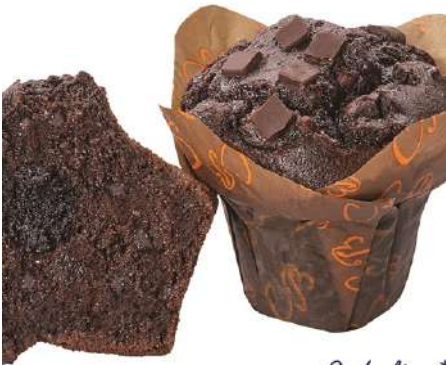
70606 DOUBLE CHOC MUFFIN TK, m. Crunch, 34 Stück á 135 g/Karton