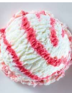
72411 JOGHURT-HIMBEER EIS TK, 5 Liter/Wanne