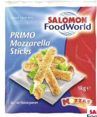
72103 MOZZARELLA-STICKS TK, Primo, 6 x 1 kg/Karton