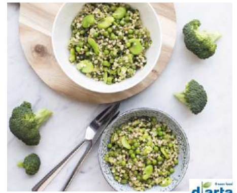
72210 SALAT GREEN VALLEY TK, 4 x 1,25 kg/Karton