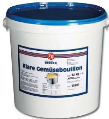
15800 KLARE GEMÜSE- BOUILLON ohne Einlage, 12 kg ODPZ -A/Eimer