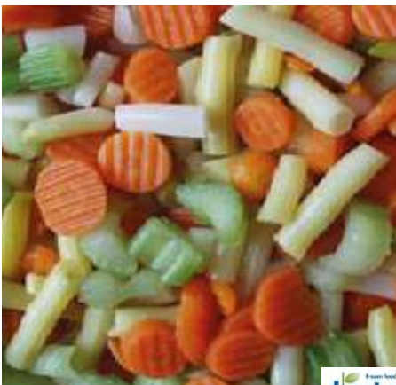
71027 SCHONKOSTMISCHUNG TK, 4 x 2,5 kg/Karton