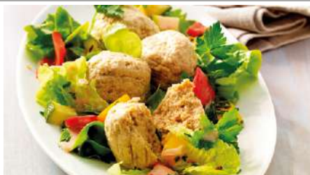
71341 VEGETARISCHE KLOPSE TK, roh, 160 x 40 g/Karton