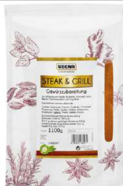
44605 STEAK+GRILL-WÜRZMISCHUNG Zipbeutel, 1100 g/Packung UBENA