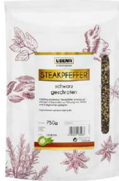
44601 STEAK-PFEFFER geschrotet Zipbeutel, 750 g/Packung UBENA