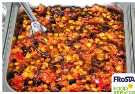
70799 CHILI CON QUINOA TK, 6 x 1,5 kg/Karton