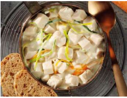
70165 HÄHNCHENBRUSTFILET- WÜRFEL gegart, 20x 20 mm, TK, 10 kg/Karton