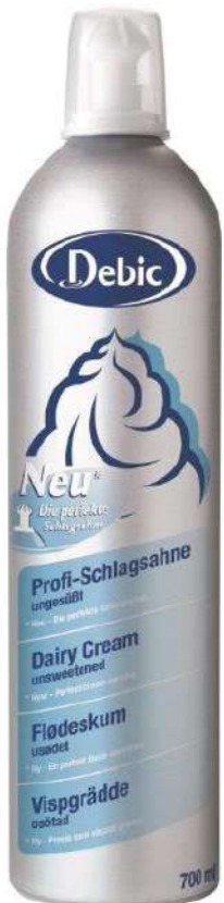
28826 SPRÜHSAHNE 35% ungesüßt 6 Dosen à 700 ml/Karton