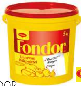
10415 FONDOR UNIVERSAL WÜRZE rein pflanzlich, O.K.A., 5 kg/Eimer