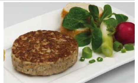
73309 BELFROST FRIKADELLE 100 g, vorgebraten TK, Schweinefleisch, 30 Stk./Karton