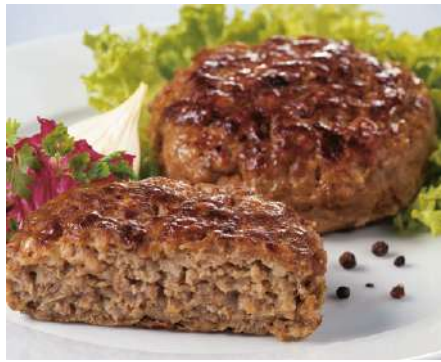
70498 FRIKADELLE FLEISCHERMEISTER TK, DPR, 48 x 125 g/Karton