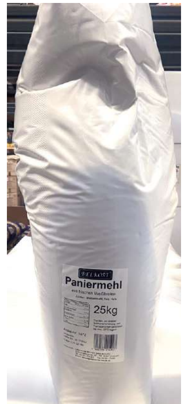
1472 PANIERMEHL 25 kg/Sack