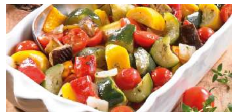
73114 SPANISCHES GRILL- PFANNENGEMÜSE in mediterranen Sauce TK, 6 x 1,5 kg/Karton