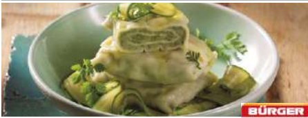
70983 MAULTASCHEN TK, gerollt, 4 x 25 Stk. à 85 g/Karton