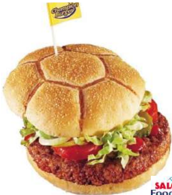
70403 QUICK & EASY BURGER TK, gebraten, 40 x 100 g/Karton