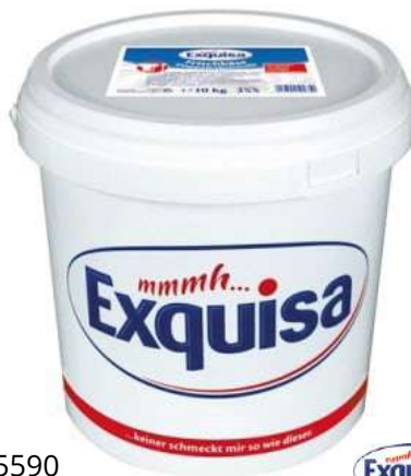
35590 FRISCHKÄSE NATUR 70 % 10 kg/Eimer