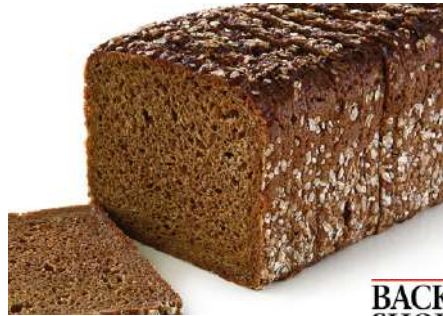
71534 VOLLKORNBROT gebacken, geschnitten, 8 x 1000 g TK, á 24 Scheiben/Karton