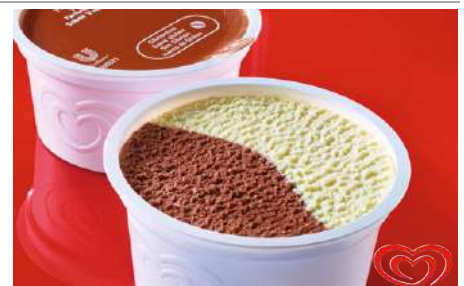
72421 EISBECHER SCHOKO VANILLE TK, 60 x 70 ml/Karton