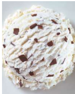
72416 STRACCIATELLA EIS TK, 5 Liter/Wanne