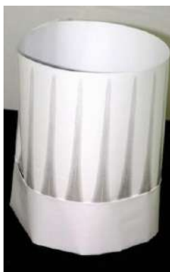
63738 KOCH- MÜTZEN weiß, Papier, 23 cm, 50 Stück/Paket