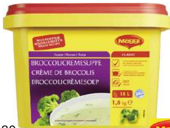
10580 MEISTERKLASSE BROCCOLICREMESUPPE vegetarisch, OK, 2 x 1,8 kg/Karton