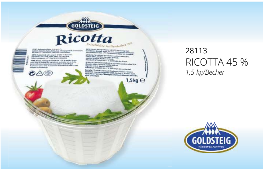
28113 RICOTTA 45 % 1,5 kg/Becher