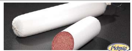
34355 SALAMI weiß, geräuchert, Kal. 80, ca. 2 kg/Stück