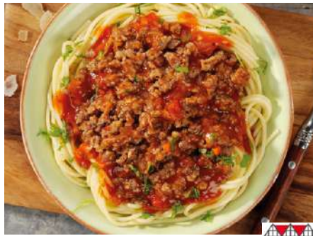
75948 RINDERHACKFLEISCH TK, gegart, gewürzt, 4 x 2,5 kg/Karton