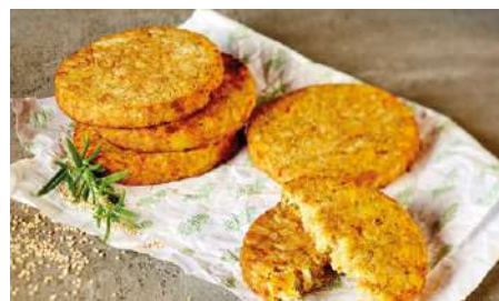
76199 SÜSSKARTOFFEL- AMARANTH-BURGER TK, vorfrittiert, 40 x 125 g/Karton