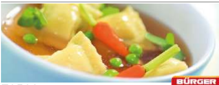
73583 SUPPENMAULTASCHE TK, Gemüse, vorgegart, 2 x 2,5 kg/Karton