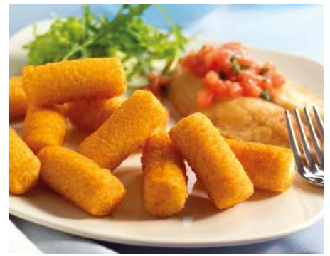
70205 KROKETTEN lang, paniert, ca. 25 g/Stück, TK, 2 x 2,5 kg/Karton