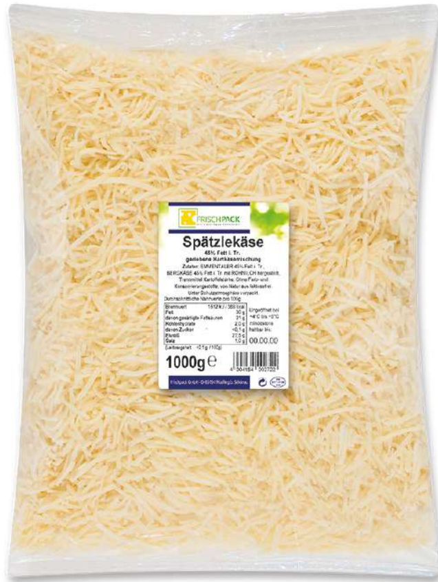
35752 SPÄTZLEKÄSE 45% 2-3 mm, gerieben, 1 kg/Beutel