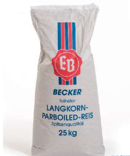
1275 PARBOILED SPITZENREIS 25 kg/Sack