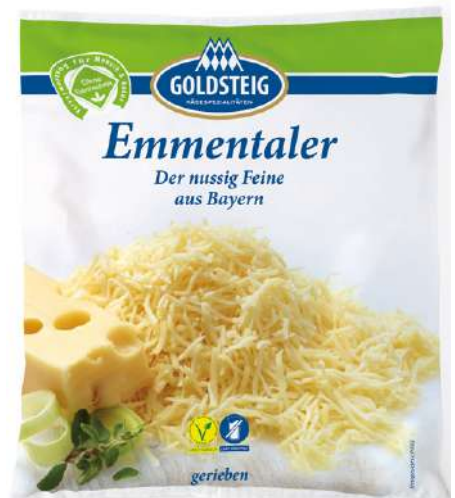
36049 EMMENTALER gerieben, oGt BY, 45 % Fett i. Tr. 1 kg/Beutel