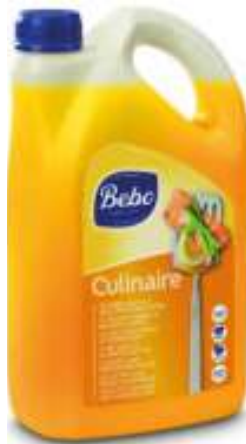
28350 BEBO CULINAIRE MARGARINE z. backen & braten 2,5 Liter/Flasche