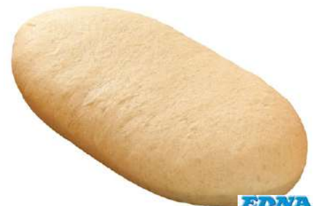
77215 PANINI NATUR TK, vorgebacken, 15 x 130 g/Karton