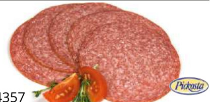
34357 SALAMI geschnitten, Atmos, Kal. 100, 500 g/Packung