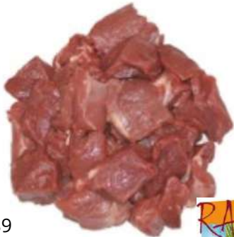
70289 WILDSCHWEINEDEL- GULASCH TK, handgeschnitten, 4 x 2,5 kg/Karton