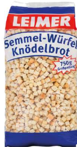
7934 SEMME- WÜRFEL 8 Beutel à 750 g/Karton