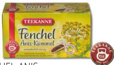
54309 FENCHEL-ANIS- KÜMMELTEE 12 x 20 Stück/Karton