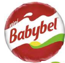
35543 MINI-BABYBEL KLASSIK 45% laktosefrei, 96 Stück à 20 g/Karton