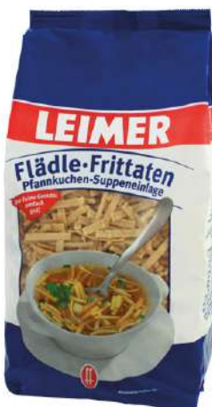
7931 FLÄDLE FRITTATEN 4 Packungen à 1 kg/Karton