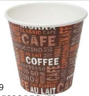
63889 ESPRESSOBECHER Coffee Collection, 100 ml, 4 oz, Pappe, 50 Stück/Paket