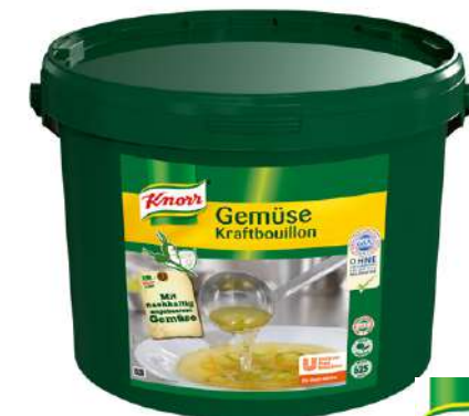
13601 GEMÜSE-KRAFTBOUILLON o.d.Z./o.d.A., 12,5 kg/Eimer