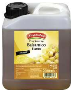
36529 BALSAMICO BIANCO 5,4% 2 Liter/Kanister