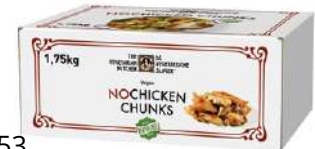
72053 NO CHICKEN CHUNKS veganes Geschnetztes, o.d.Z., TK, 1,75 kg/Karton