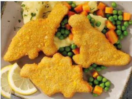
70534 HÄHNCHENNUGGETS DINO fertig gebraten, TK, ca. 40 g/Stück, 10 kg/Karton