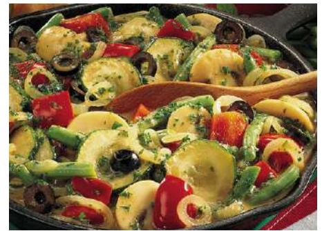
73106 PFANNENGEMÜSE ITALIENISCHE ART in mediterraner Kräutersauce TK, 6 x 1,5 kg/Karton