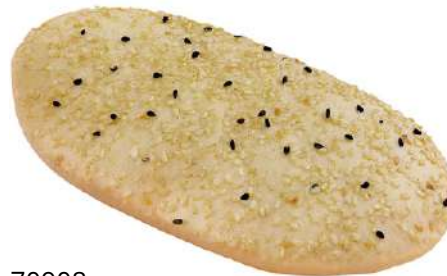
70908 PANINI MIT NIGELLASAAT TK, vorgebacken, 30 x 70 g/Karton