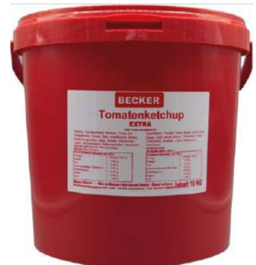
36868 TOMATENKETCHUP 10 kg/Eimer