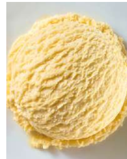
72419 EIS VANILLE- GESCHMACK TK, 5 Liter/Wanne