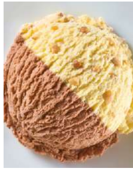
72412 NOUGAT-KROKANT EIS TK, 5 Liter/Wanne