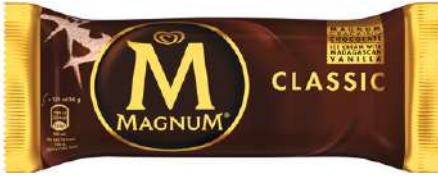
71145 MAGNUM CLASSIC TK, 20 x 120 ml/Karton