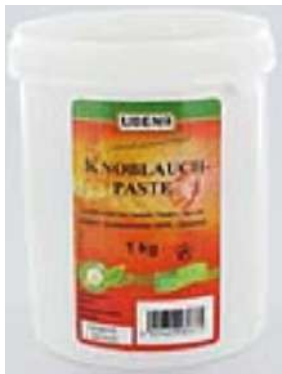
44368 KNOBLAUCHPASTE 1 kg/Dose UBENA