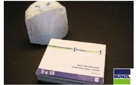
63779 CHEF KOCHMÜTZEN mit Falten, 22,5 cm, 50 Stück/Karton