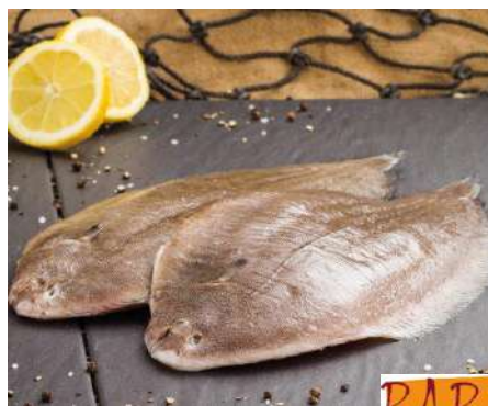
71496 NORDSEE SEEZUNGEN ausgenommen, ca. 300 - 400g/Stück TK, IQF, 10 kg/Karton