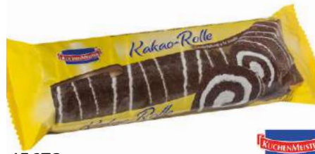
45673 KAKAO / VANILLE ROLLE 5 x 400 g/Karton