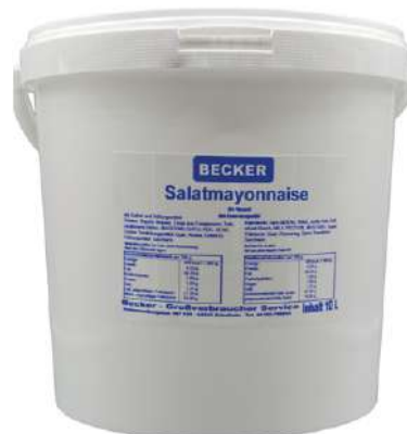
35511 SALAT-MAYONNAISE 10 Ltr./Eimer