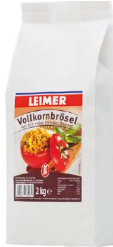
7939 VOLLKORN- BRÖSEL 2 kg/Packung