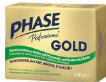
85556 PHASE PROFESSIONAL WiBu/Gold, wie Butter zu Verwenden o.d.Z., 20 x 250 g/Karton