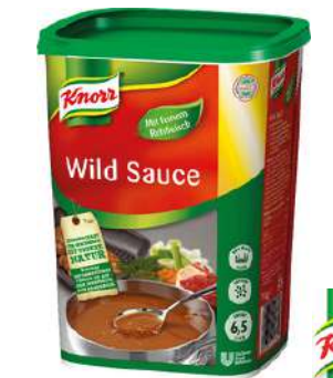
13550 WILD SAUCE Gourmet Qualität o.d.Z. 1 kg/Dose