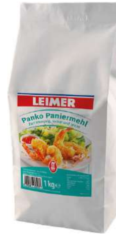
7938 PANKO PANIERMEHL 1 kg/Packung