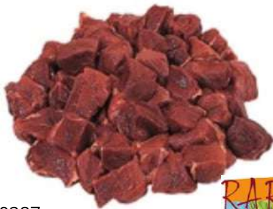
70287 HIRSCHEDELGULASCH Schulter/Nacken handgeschnitten, TK, 2 x 2,5 kg/Karton