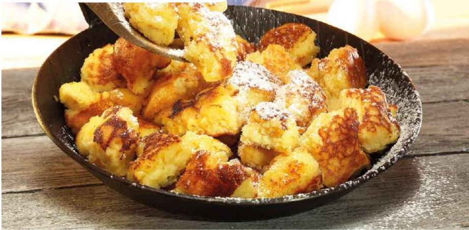
70608 KAISERSCHMARRN MIT ROSINEN TK, 5 x 1 kg/Karton