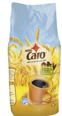
53182 CARO INSTANT rein pflanzlich, OK, 10 x 500 g/Karton