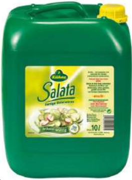
32479 SALATA SALATWÜRZE (ESSIG) 10 Ltr./Kanister