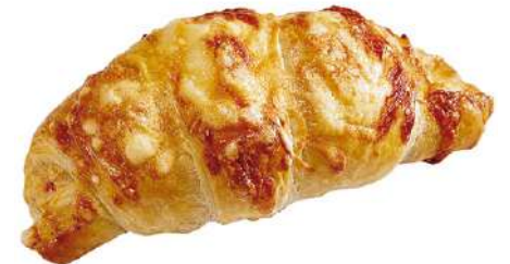
76041 SCHINKEN-KÄSE- CROISSANT Teigling, vorgegärt, TK, 50 x 100 g/Karton