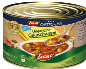
35074 GULASCHSUPPE 1 Dose 5/1