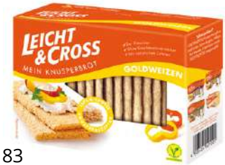
51183 LEICHT&CROSS BROT WEIZEN 8 Pakete à 125 g/Karton