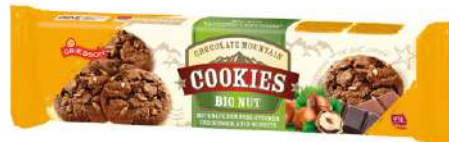
49431 GRIESSON-DE BEUKELAER BIG NUT COOKIES 14 Packungen à 150 g/Karton