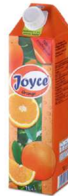
42654 ORANGENSAFT 100 % TetraPak mit Schraubverschluss 12 x 1 Ltr./Karton