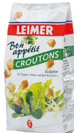
7936 CROUTONS KRÄUTER 5 Packungen à 500 g/Karton