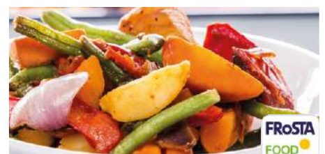
73139 OFEN-GEMÜSE RUSTIKAL TK, 6 x 1,5 kg/Karton