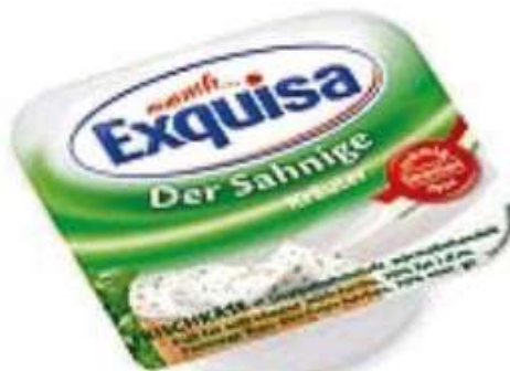
35572 KRÄUTER 65 % 40 x 20 g/Karton