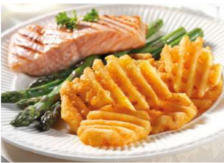
70283 CRISSCUTS TK, D24, 4 x 2,5 kg/Karton