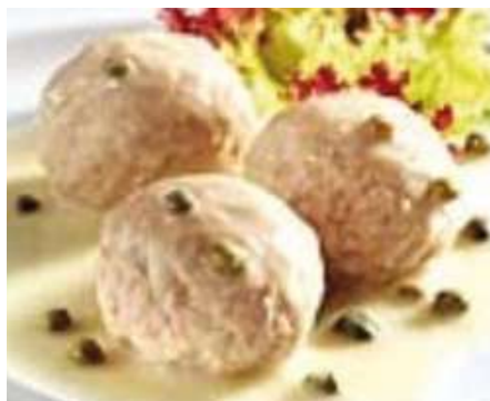
74420 KÖNIGSBERGER KLOPSE TK, ohne Zwiebeln, 200 x 40 g/Karton