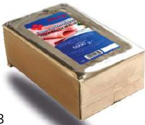
34093 FORM-VORDERSCHEINEN 85% Schweinefleisch, 4 x 5 kg Block/Karton