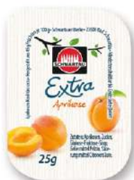
59401 APRIKOSEN KONFITÜRE EXTRA o.d.Z./o.d.A. 100 x 25 g/Karton