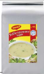
10635 SELLERIE- CREMESUPPE vegetarisch, OK, 2 x 3 kg/Packung