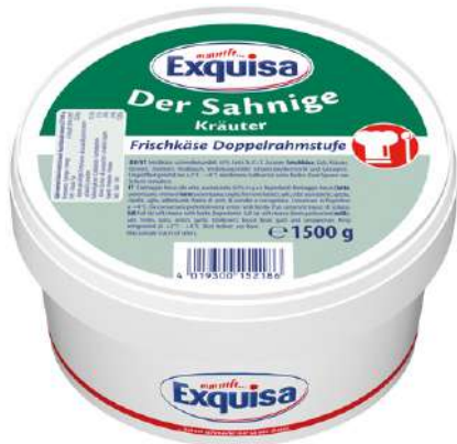
35518 FRISCHKÄSE KRÄUTER 70 % 1,5 kg/Becher