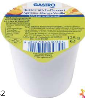
28382 GASTRO BUTTERMILCH DESSERT 4,5% sortiert, 20 Becher à 125 g/Karton