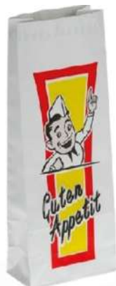
63764 HÄHNCHEN- BEUTEL FÜR 1/2 HÄHNCHEN 105 x 60 x 240 mm 100 Stück mit Alufolie/ Paket