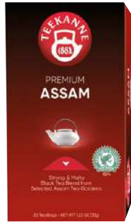
54280 PREMIUM ASSAM SELECTION 10 x 20 Stück/Karton