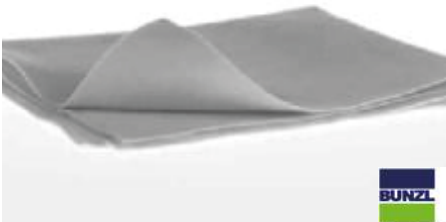
24162 ALLZWECKTUCH VLIES weiß, 38 x 40 cm, 480 Stück/Karton