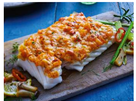
72243 SCHLEMMERFILET ITALIANO TK, nachhaltiger Fang, 30 x 180 g/Karton