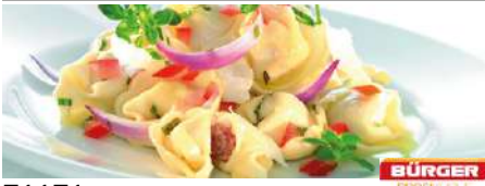
71171 TORTELLINI mit Rindfleisch TK, vorgegart, 2 x 2,5 kg/Karton