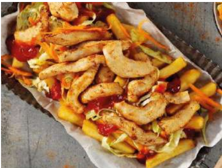
70169 HÄHNCHENINNENFILET STREIFEN gebraten, ca. 12 mm, TK, 2 x 3 kg/Karton