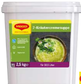
10602 7 KRÄUTER- CREMESUPPE vegetarisch, OK, 2 x 2,5 kg/Karton