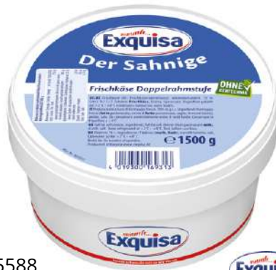
35588 FRISCHKÄSE NATUR 70 % 1,5 kg/Becher