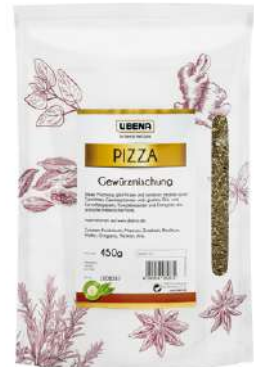
44615 PIZZAGEWÜRZ Zipbeutel, 450 g/Packung UBENA