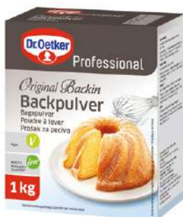
15005 BACKIN o.d.Z./o.d.A., 1 kg/Paket