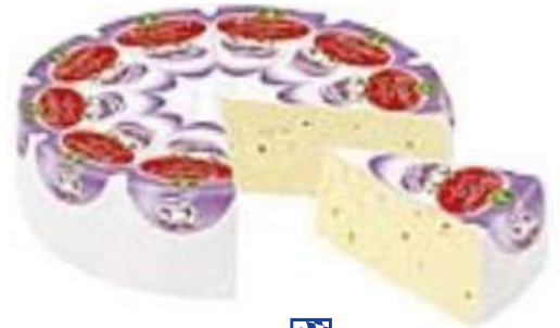
35713 ALLGÄUER RAHMTORTE KNOBLAUCH 65 % 1,6 kg BFN/Karton