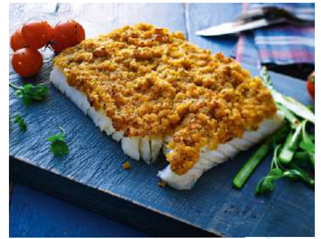
71385 SCHLEMMERFILET BORDELAISE TK, nachhaltiger Fang, 35 x 130 g/Karton