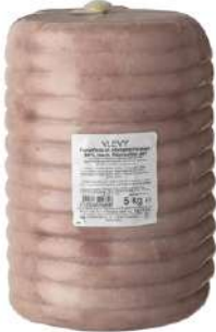
34097 GEK. HINTER- SCHINKEN gef. 85% Schweinefleisch, rund Kal. 15,5 cm, 5 kg /Stück