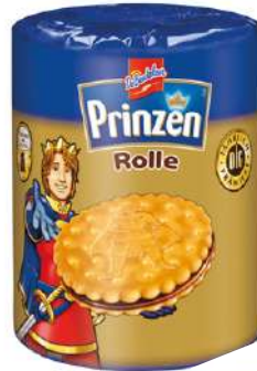
49624 PRINZEN ROLLE 24 Rollen, à 141 g/Karton