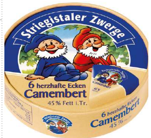
35732 STRIEGEL CAMENBERT ECKEN 45 % einzeln verpackt, 36 x 42 g/Karton