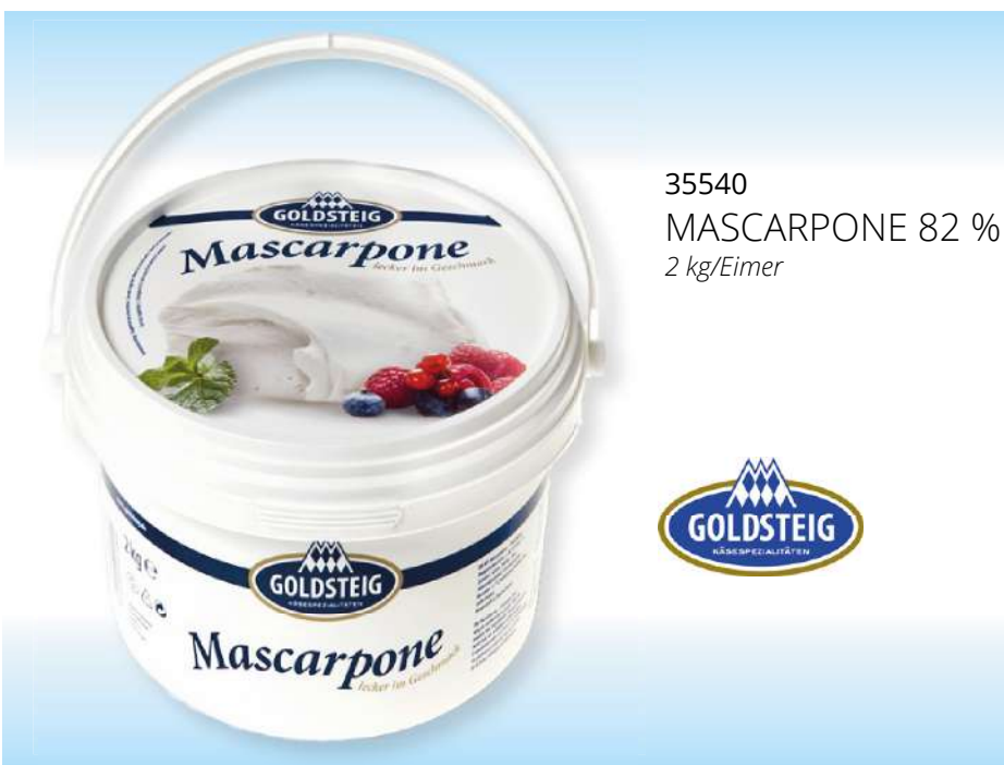
35540 MASCARPONE 82 % 2 kg/Eimer