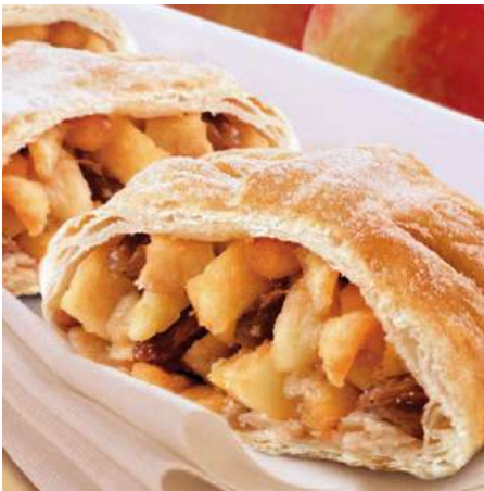
71015 APFELSTRUDEL TK, gebacken, Blätterteig, 20 x ca. 110 g/Karton