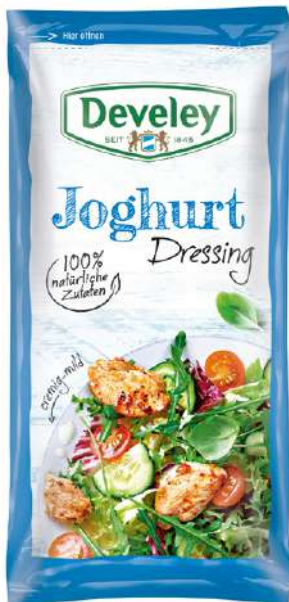
35393 JOGHURT DRESSING 14 Beutel à 75 ml./Karton