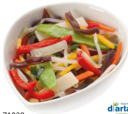
71028 CHINA GEMÜSE TK, halalfähig, 4 x 2,5 kg/Karton