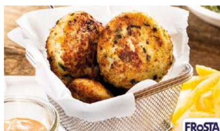
70800 KAPITÄNS-FRIKADELLE TK, vorgebraten unpaniert (NF), nachh. Fang, ca. 48 x 63 g/Karton