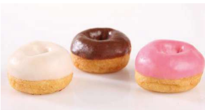
71839 MINI DONUT MIX TK, fertig gebacken, 150 Stück á 12 g/Karton