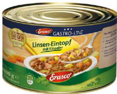
35050 LINSENEINTOPF 1 Dose 5/1