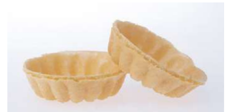
51107 WAFFELSCHALEN FÜR KONFITÜRE €/KT 1000 Stück/Karton 21,95