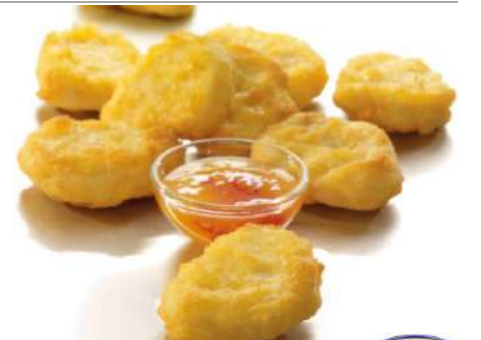
71019 HÄHNCHENNUGGETS TK, gegart, im Backteig, 3 x 1 kg/Karton