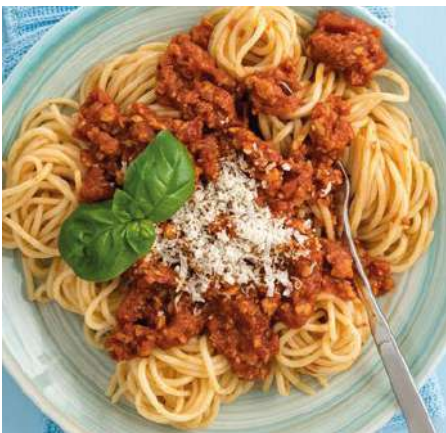
70964 HÄHNCHEN- HACKFLEISCH TK, gegart, IQF, 2 x 5 kg/Karton