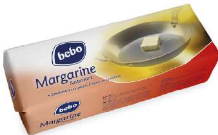
28319 BEBO RESTAURANT- MARGARINE 80 % 4 x 2,5 kg/Karton