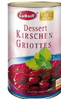
81562 DESSERT KIRSCHEN o.d.Z./o.d.A. leicht gebunden 2 kg/Dose