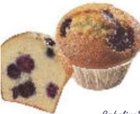
73494 MUFFINS MIT BLAUBEERE TK, 36 Stück á 75 g/Karton