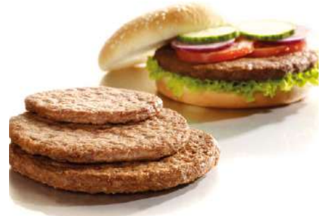
70617 HAMBURGER TK, Rindfleisch, roh, 27 x 180 g/Karton