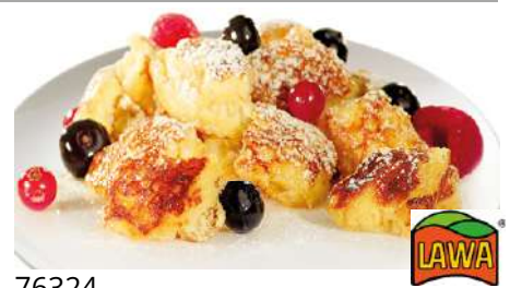
76324 KAISERSCHMARRN TK, ohne Rosinen, 5 kg/Karton