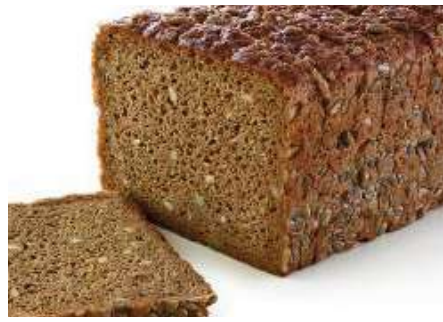
71533 SONNENBLUMEN- KERNBROT gebacken, geschnitten, 8 x 1000 g TK, á 24 Scheiben/Karton