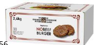
72056 NO BEEF BURGER vegane Burger, o.d.Z. TK, 30 Stk. à ca. 80 g/Karton