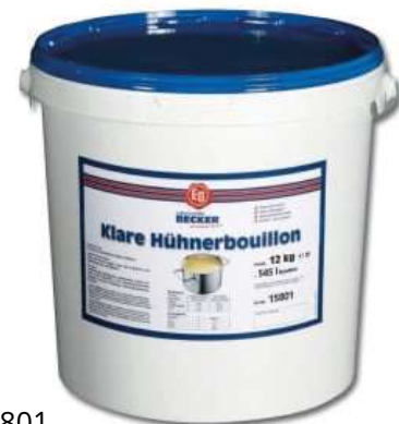
15801 KLARE HÜHNER- KRAFTBOUILLON 12 kg ODPZ -A/Eimer