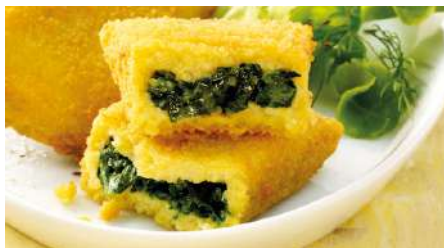
70214 VEG. POLENTATASCHE FLORENTIN Kombidämpfer TK, geeignet, 80 x ca. 75 g/Karton