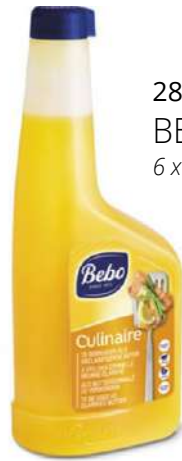
28340 BEBO CULINAIRE 6 x 900 ml/Flasche