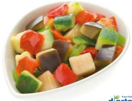
70141 RATATOUILLE TK, 4 x 2,5 kg/Karton