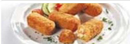
70190 KNUSPERKROKETTEN GÄRTNERIN TK, paniert, roh, 158 x 38 g, 6 kg/Karton