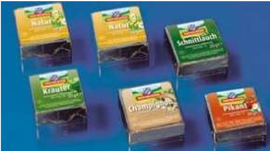
35624 SCHMELZKÄSE SORTIERT 30 % 6 x 36 Stk. à 20 g/Karton