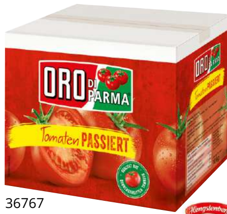
36767 PASSIERTE TOMATEN ORO DI PARMA 10 kg/BIB