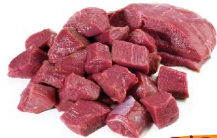
71168 REHGULASCH TK, handgeschnitten, 4 x 2,5 kg/Karton