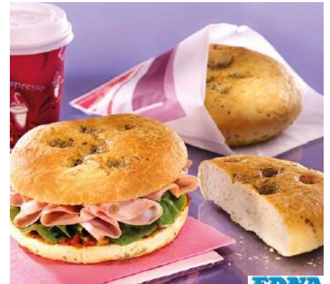
73132 FOCACCIA ROSMARIN TK, fertig gebacken, 36 x 88 g/Karton