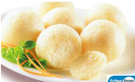
70369 KARTOFFEL-KLÖSSE TK, 133 x ca. 75 g/Karton