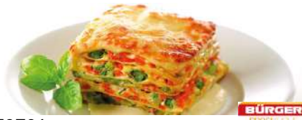
79701 LASAGNE PRIMAVERA TK, vegetarisch 1/1 GN, 24 x 330g/Karton