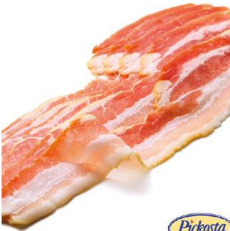
34810 BACON IN SCHEIBEN 1 kg/PK