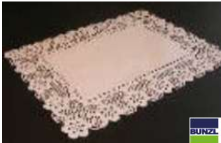
63734 SPITZENPAPIER 36 x 45 cm, 250 Stück/Paket