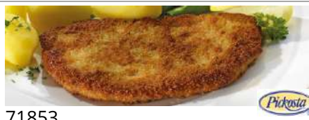
71853 SCHWEINELACHSSCHNITZEL TK, roh, paniert, 40 x 180 g/Karton