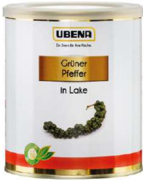
44331 PFEFFER GRÜN IN LAKE 500 g/Dose UBENA