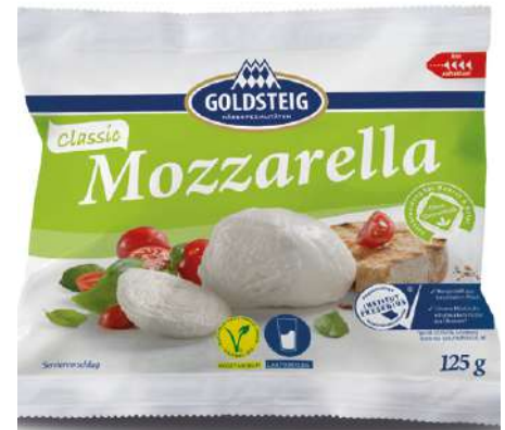
35620 MOZZARELLA oGt BY, 45 % Fett i. Tr. 10 x 125 g/Karton