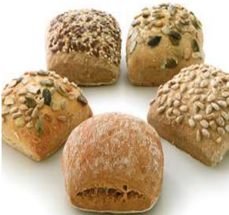
71110 MINI BRÖTCHENMIX RUSTIKAL Kürb / Kürbmix / Mehrk / Sonne / Schus, vorgebacken, TK, 5 x 35 Stück á 40 g/Karton