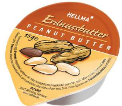
58603 ERDNUSSBUTTER PORTIONEN €/Stk. 80 x 15 g/Karton 0,119