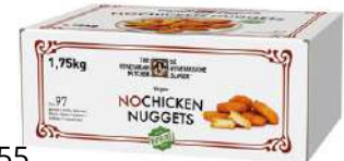
72055 NO CHICKEN NUGGETS vegane Nuggets, o.d.Z., TK, 97 Stk. à ca. 18 g/Karton