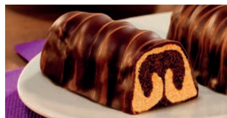
47117 MINI MARMOR KUCHEN fertig gebacken, einzeln verpackt, 35 g/St., 27 St./Karton