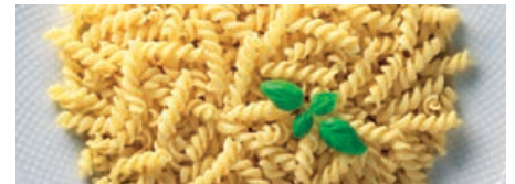
71630 SPIRELLI ohne Ei, vorgekocht, IQF, TK, 1 x 10 kg, 10 kg/Karton