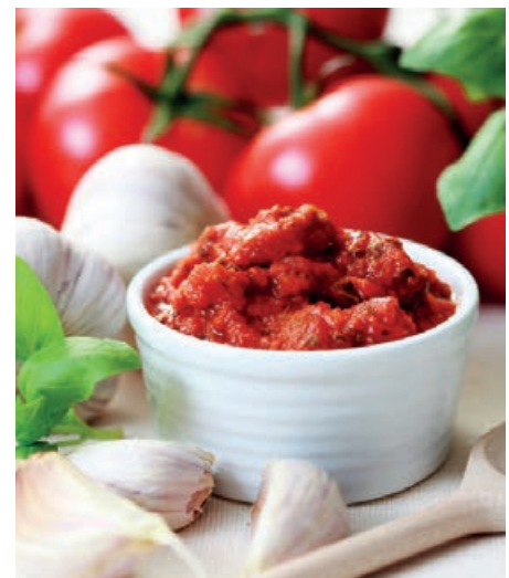
32818 TOMATENPULPE Bag in Box, 10 kg/Karton