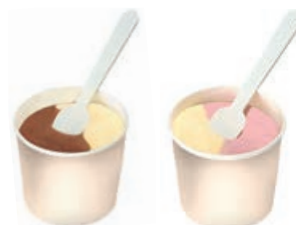
71974 VANILLE SCHOKO BECHER TK, 70 ml/Becher, 24 Be./Karton