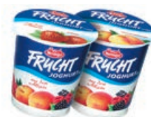
28083 MIX FRUCHTJOGHURT 3,5 % sortiert, 150 g/Becher, 20 Be./Karton