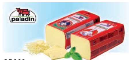
35660 PALADIN EDAMER 30 % Brote, BFN, ca. 3 x 3,33 kg/Karton, 9,99 kg/Karton