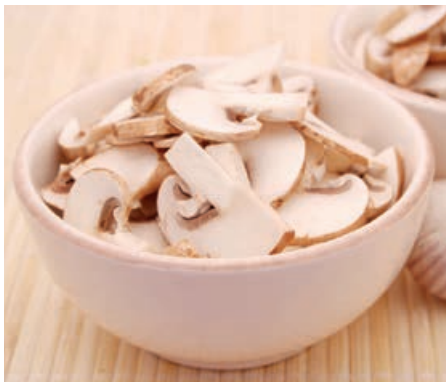
32932 CHAMPIGNONS 2. Wahl, in Scheiben, 3/1, 1.380g/Ds., 6 Ds./Karton