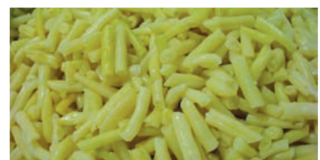
32458 WACHSBRECH- BOHNENSALAT 5/1, 2.200g/Ds., 3 Ds./Karton