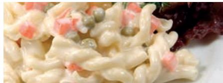
30022 NUDELSALAT in einer würzigen Salatmayo, 3 kg/Eimer