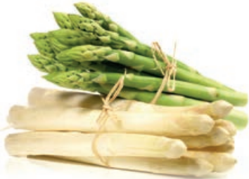
71007 STANGENSPIRGEL WEISS blanchiert, 16/22, TK, 10 x 1 kg/Karton