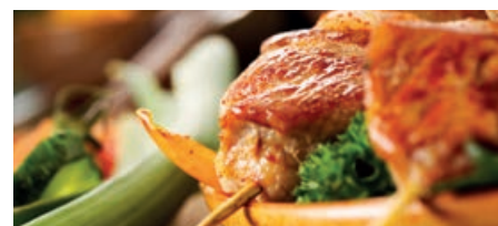
34636 PUTENSPIESSE aus der Brust, küchenfertig gewürzt, Atmospackung, ca. 180 g/St., 20 St./Karton