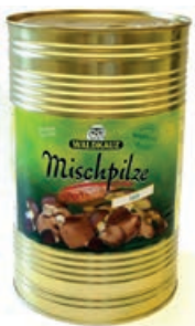
32919 MISCHPILZE HELL 5/1, 2.250g/Ds.