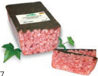
34797 SÜLZE HAUSMACHER ART vacuumiert, 2 kg/St.