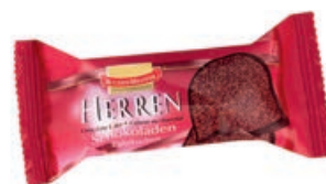
47118 MINI HERREN KUCHEN fertig gebacken, einzeln verpackt, 35 g/St., 27 St./Karton