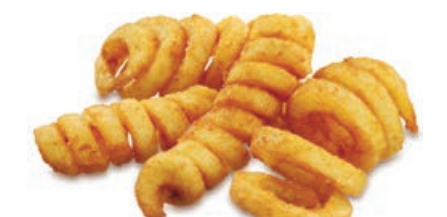
70374 TWISTERS D72, gewürzt, 4 x 2,5 kg, 10 kg/Karton