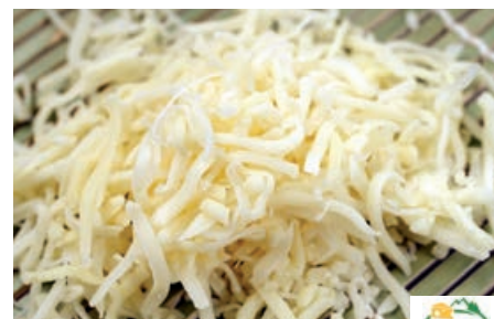
35522 GOUDA/EDAMER 45 % Raspelmix, 2 kg/Beutel