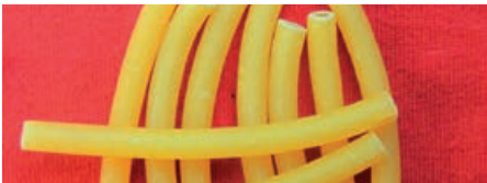
9601 GASTRO NUDELN MACCARONI Frisch-Ei, 5 kg/Karton