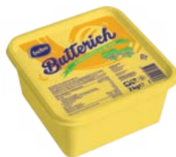
28254 BEBO BUTTERICH MARGARINE 60 % mit buttrigem Geschmack, 2 kg/Be.