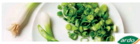
71088 FRÜHLINGSZWIEBEL Ringe, 3-6 mm, TK, 10 kg/Karton