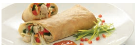
71254 FRÜHLINGSROLLE mit gegartem Hähnchen, vorfrittiert, TK, 150 g/St., 20 St./Karton