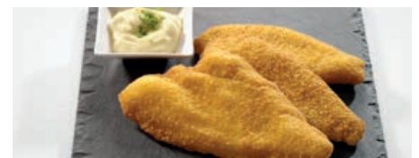
71910 SCHOLLEN- DOPPELFILET paniert, vorgebraten, nachhaltiger Fang, TK, 5 kg/Karton, 140-160 g/St.