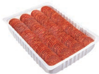
34448 PEPERONIWURST Kaliber 38, geschnitten, Atmos, 1.000 g/Pack.