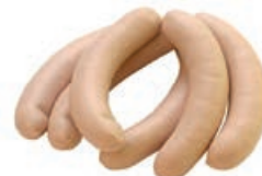
34639 PUTENBRATWURST fein, 5 x 10 x 100 g, 5 kg/Karton