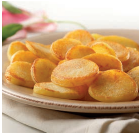
32722 FRISCHE KARTOFFELSCHNITTEN 6 mm, vorgegart, 6 x 2 kg, 12 kg/Karton