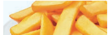
70391 STEAKHOUSE POMMES 9 x 18 mm, TK, 5 x 2,5 kg/Btl., 12,5 kg/Karton