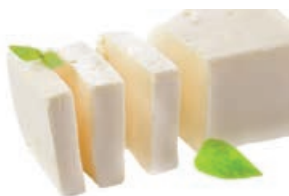
28029 MOLKEREIBUTTER mildgesäuert, 5 kg/Karton