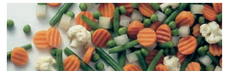
71914 FRÜHLINGSGEMÜSE 5-fach sortiert, TK, 4 x 2,5 kg, 10 kg/Karton