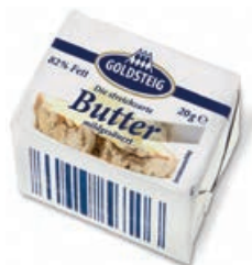
28143 BUTTER Portionen, 20 g/St., 100 St./Karton