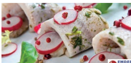
30060 MATJESFILETS IN ÖL 3 l (2.250 g/35-40 St.)/Eimer