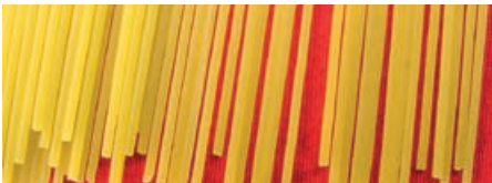
9602 GASTRO NUDELN SPAGHETTI Frisch-Ei, 5 kg/Karton