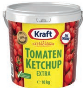
36861 TOMATEN KETCHUP extra, 10 kg/Eimer