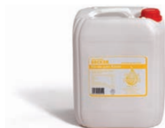
28210 RAPSÖL 10 l/Kanister