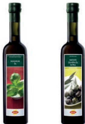
28335 BASILIKUMÖL Erstpressung, 500 ml/Fl.