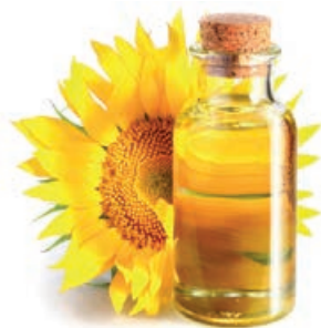
28018 SONNENBLUMENÖL 10 l/Kanister