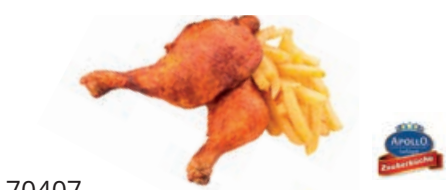
70407 HÄHNCHENSCHENKEL gebraten, TK, ca. 180 g/St., 5 kg/Karton