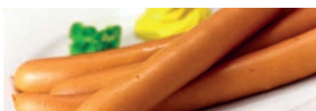
34427 GEFLÜGELWIENER 4 x 20 x 70 g, 5,6 kg/Karton