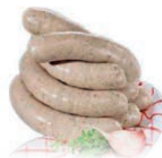
34004 BÄRLAUCHBRATWURST fein, 5 x 10 x 120 g, 6 kg/Karton