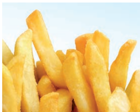
34500 FRISCHE POMMES FRITES 10 MM 2 x 5 kg/Btl., 10 kg/Karton