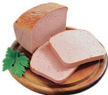
34370 BACKLEBERKÄSE verzehrfertig, 2,1 kg/Pack.