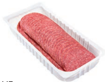
34447 PIZZA-SALAMI Kaliber 55, geschnitten, Atmos, 1.000 g/Pack.