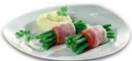
70181 BOHNEN-BOUQUET roh, Bündchen aus feinen grünen Bohnen, umwickelt von herzhaftem Bauchspeck, ca. 40 g/Stück, 50 St./Karton