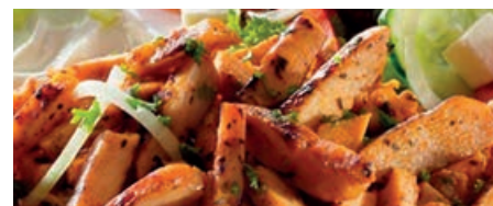
34822 PUTENGYROS frisch, mit Zwiebeln, vacuumiert, 4 kg/Pack.

Die Angebote sind freibleibend und gelten nur solange der Vorrat reicht. Die Preise verstehen sich zzgl. der gesetzlichen Mehrwertsteuer. Druckfehler vorbehalten. Das Bildmaterial kann vom Originalprodukt abweichen. Es gelten die Allgemeinen Geschäftsbedingungen, diese finden sie auf unserer Website www.lebensmittel-becker.de . Der Mindestauftragswert beträgt 500 Euro.