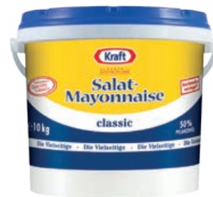
35512 SALAT-MAYO 51 % 10 kg/Eimer