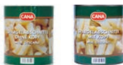
33002 SPARGELABSCHNITTE weiß, geschält, ohne Köpfe, Atg. 1.850 g/Ds., 6 Ds./Karton