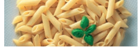
70663 PENNE ohne Ei, vorgekocht, IQF, TK, 1 x 10 kg, 10 kg/Karton