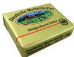
28146 BUTTER Portionen, 10 g/St., 200 St./Karton