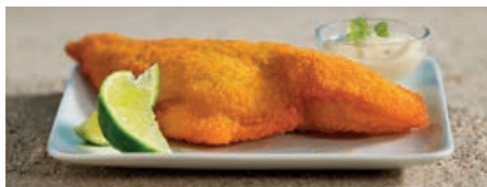
70268 SCHOLLENFILET paniert, Doppelfilet, 10 % Glasur, TK, 5 kg/Karton, 140-160 g/St.