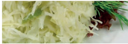
30000 WEISSKRAUTSALAT Essig/Öl, 5 kg/Eimer