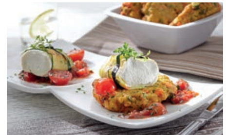
71843 GEMÜSE-FRIKADELLE vorgebacken, vegetarisch, TK, ca. 120g/St., 5 kg/Karton