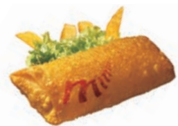
71258 FRÜHLINGSROLLE ASIATISCH vorfrittiert, TK, 150 g/St., 12 St./Karton