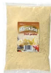
35532 HARTKÄSE GERIEBEN 40 % Italienische Art, 1 kg/Beutel, 5 Beutel/Karton