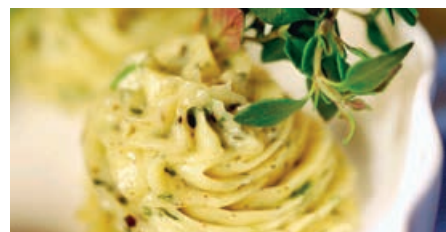
71295 KRÄUTERBUTTER ROSETTEN ohne Knoblauch, TK, ca. 10 g/Stück, 100 St./Karton