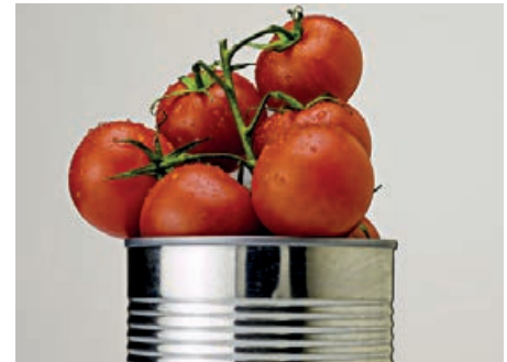
32816 SCHÄLTOMATEN LABELLA NAPOLI 3/1, 1.530 g/Ds., 6 Ds./Karton