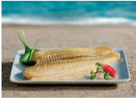
70266 SCHOLLENFILET natur, Doppelfilet, 10 % Glasur, TK, 5 kg/Karton, 160-180 g/St.