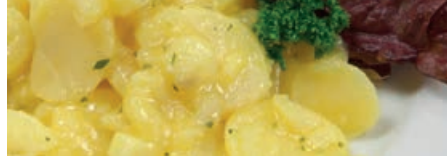
30007 KARTOFFELSALAT Essig/Öl, ohne Glutamat, 5 kg/Eimer