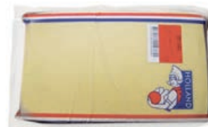
35606 EDAMER 40 % BFN, Block, 15,8 kg/St.