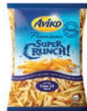
71819 POMMES SUPER CRUNCH vorgebacken, 9,5 mm, TK, 4 x 2,5 kg, 10 kg/Karton