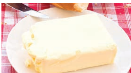
28020 MARKENBUTTER mildgesäuert, 40 x 250 g, 10 kg/Karton