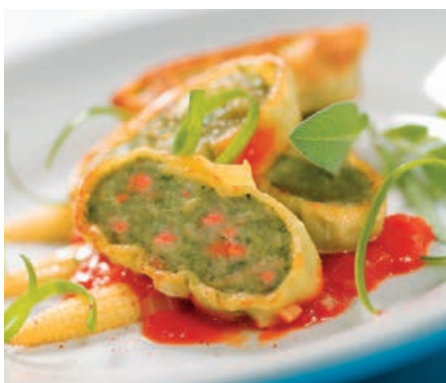
70978 GEMÜSE- MAULTASCHEN vorgegart, geschnitten, TK, 6 kg/Karton